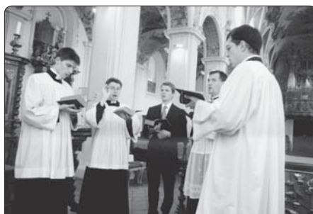
Zpívaná sekvence „Veni Sancte Spiritus“ má svoje povinné liturgické místo ve mši svaté o Svatodušní neděli.

V tomto smyslu pokračuje také šestá sloka: Úplně chudý a závislý na Bohu si prosebník uvědomuje: „Člověk bez tvé pomoci, slábne a je bez moci, vše mu může uškodit.“ Tím sahá sekvence na Boží slovo: „Neboť beze mne nemůžete dělat nic.“ (Jan 15,5) Duchovní působení, získání nadpřirozené ctnosti není bez Boha možné. Dary Ducha Svatého nejsou lidské talenty a nadání. Přesto zasahují dary