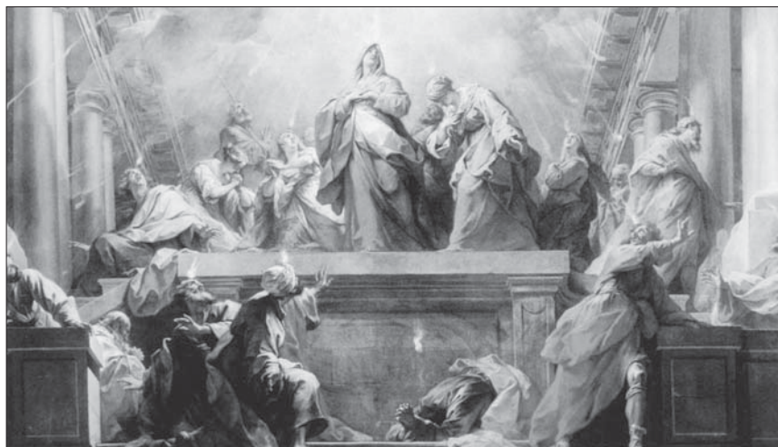
„Najednou se ozval z nebe hukot, jako když se žene silný vítr, a naplnil celý dům, kde se zdržovali. A ukázaly se jim jazyky jako z ohně, rozdělily se a nad každým z nich se usadil jeden.“ (Sk 2,2-3) Svatodušní událost v malbě Jeana Restouta II. (1732).

Uděl v ctnosti prospěchu, v smrti dodej útěchu a dej v radost věčnou vjít.