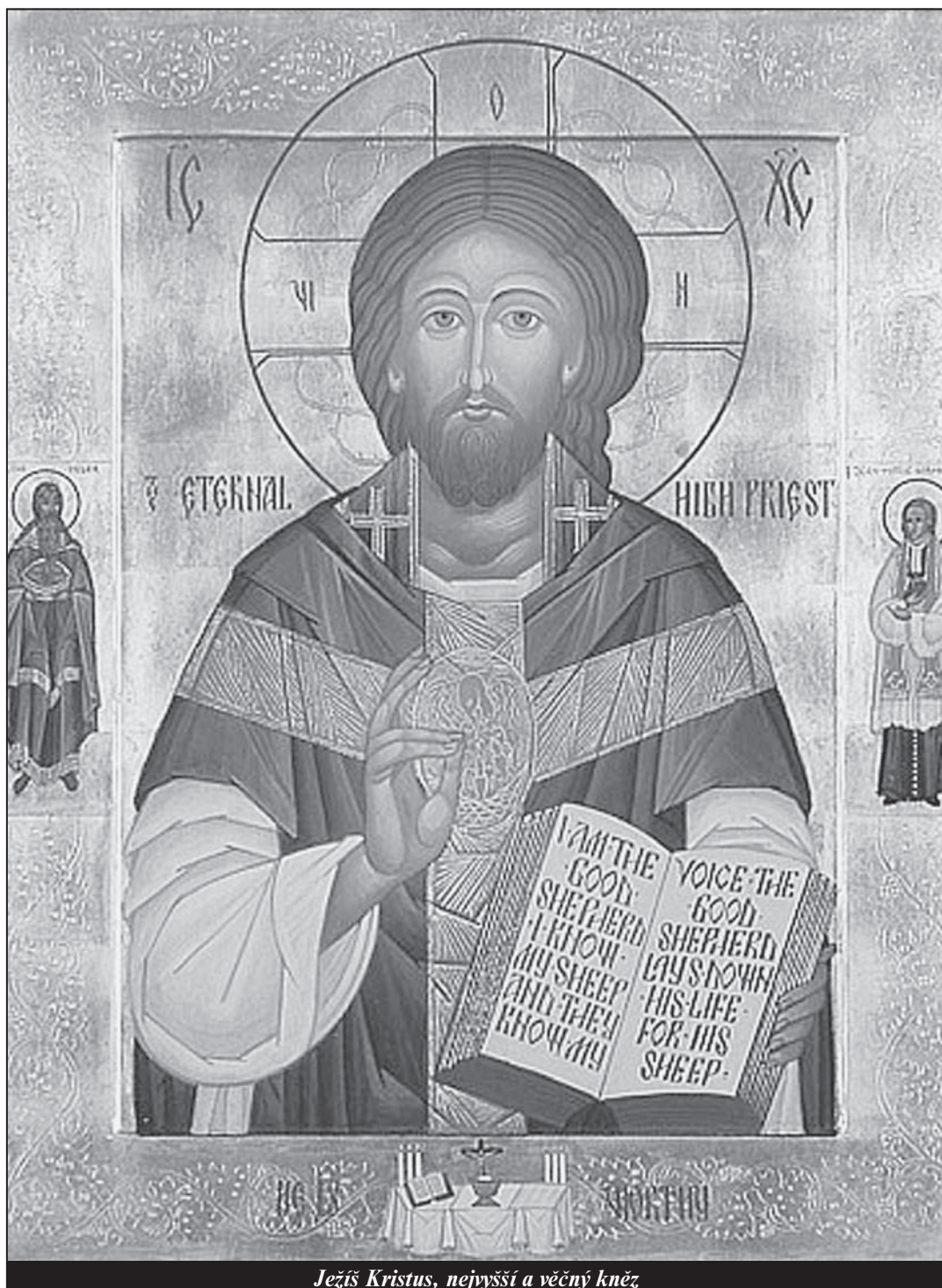
Ježíš Kristus, nejvyšší a věčný kněz