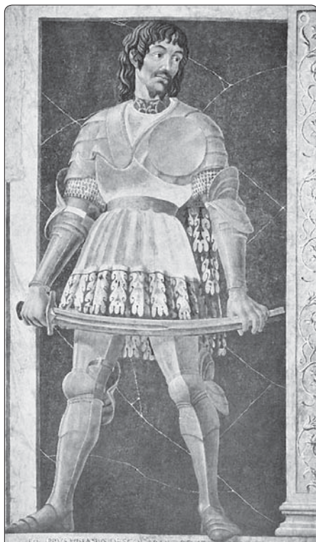
Bojovník proti husitům Pippo Spano z Ozory – italský válečník v Zikmundových službách

Českým protihusitským osobnostem vévodil Oldřich II. z Rožmberka (1403–1462), který se po bitvě u Lipan roku 1434 stal obecně respektovaným vůd-