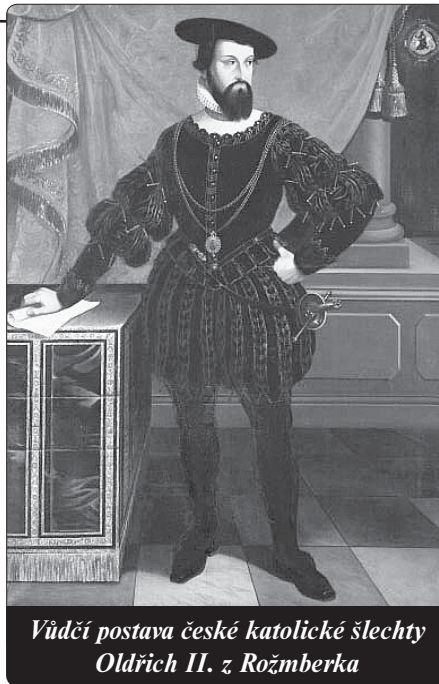
Vůdčí postava české katolické šlechty Oldřich II. z Rožmberka

Zemské elity cítily naléhavou potřebu ukončit trvalý válečný stav, zavést v zemi pořádek a zamezit řádění radikálních hu-