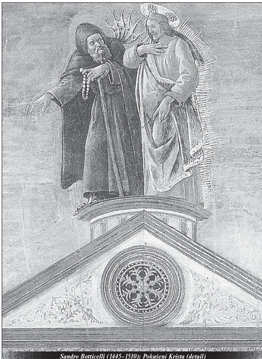
Sandro Botticelli (1445-1510): Pokušení Krista (detail)