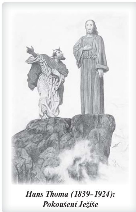
Hans Thoma (1839-1924): Pokoušení Ježíše

Druhé pokušení: Ďábel ho postavil na cimbuří chrámu a opět se snažil dovědět, jestli je Synem Božím, přičemž citoval Písmo, aby ho znovu pokoušel, aby udělal zázrak, a přitom ho nutil, aby se dopustil sebevraždy: Vrhni se z chrámu dolů... Toto pokušení zahrnuje v sobě pocit ztráty odvahy, zoufalství a provokaci Boha...