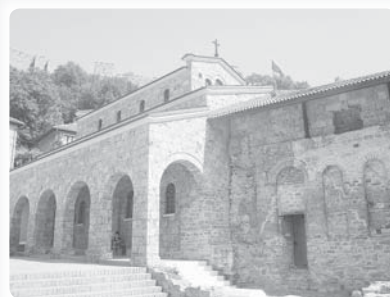
Kostel ze 13. stol. zasvěcený čtyřiceti mučedníkům ze Sebaste (Veliko Tarnovo, Bulharsko)

z nich, kteří mučení nevydrží a odpadnou, se mohli znovu zotavit. Svatí mužové se nepodřídili jeho rozsudku a spěchali radostně k rybníku. Povzbuzovali se navzájem ke stále vytrvalosti a modlili se: „Pane, nás čtyřicet začalo boj; ať nechybí ani jeden