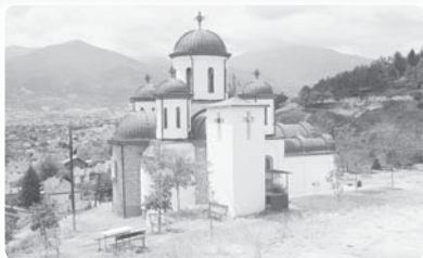
Pravoslavný kostel zasvěcený čtyřiceti mučedníkům ze Sebaste (Bitola, Makedonie)

C írkev slaví už po staletí svátek ke cti čtyřiceti mučedníků, kteří zemřeli pro Krista okolo roku 320 v Sebaste v Malé Asii. Svátek se slavil do 11. století 9. března, potom byl papežem Inocencem X. přeložen na 10. března, aby se uvolnilo místo pro svatou Anežku Římskou. Těchto čtyřicet mučedníků zastupuje mnoho neznámých statečných mužů, kteří nezapřeli svoji víru a raději podstoupili smrt, i když byla jakkoliv krutá, než aby zradili svého Pána a Spasitele. Těchto čtyřicet mučedníků bývá zobrazováno, jak stojí na zamrzlém rybníku s palmovými ratolestmi v rukou a jsou korunováni anděly.