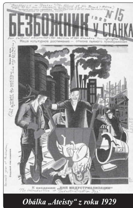
Obálka „Ateisty“ z roku 1929

Pochod vyjde v 16.30 hodin z Biskupského náměstí (vchod do arcibiskupského paláce) po trase: Mariánská, náměstí Republiky, Denisova, Ostružnická, Horní náměstí, Pavelčákova, třída Svobody, náměstí Národních hrdinů, Riegrova, Horní náměstí. Neustáváme v boji za ochranu lidského života již od jeho počětí. Chceme se solidarizovat s těmi nejmenšími, jimž je nespravedlivými zákony v ČR upíráno přirozené a nezczizitelné právo na život. Zároveň upozorňujeme, že hanebný interrupční zákon umožňuje vytvářet na nastávající maminky přímý či nepřímý tlak z okolí, aby nechaly zabít své dítě, a byly tak zraněny na těle i ve svém mateřském citu. Další informace: http://pochodprozivot.cz .