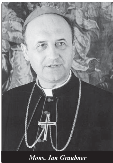
Mons. Jan Graubner

Život bez Boha se stal životem bez lásky a bez naděje. Přijaté Boží milosrdenství však přináší odpuštění a novou naději. Život se zmrtvýchvstalým Kristem dává účast