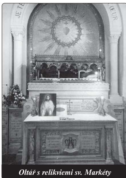
Oltář s relikviemi sv. Markéty