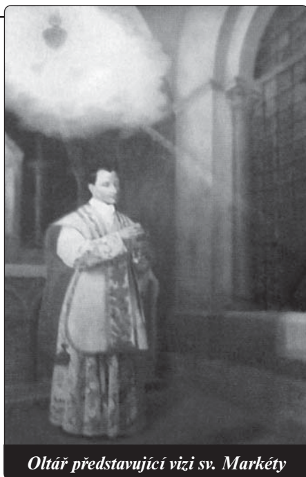
Oltář představující vizi sv. Markéty

Markéta se i nadále horlivě přičiňovala o šíření pobožnosti k Ježíšovu Srdci prostřednictvím setkávání, korespondence, ale především prostřednictvím modliteb a obětování neustálého utrpení. Viděla, jak Duch Svatý působí ve prospěch tohoto díla: poselství se rozšířilo do řádu Navštívení Panny Marie a do řádu jezuitů. Mnoho