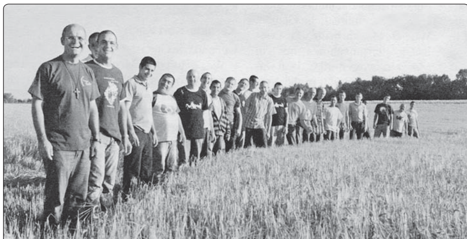
Zářící obličeje Cenacola v burgenlandském Kleinfrauenhaid