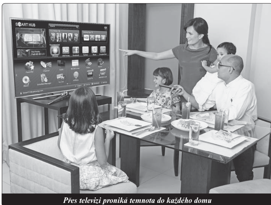
Přes televizi proniká temnota do každého domu