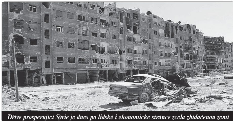
Dříve prosperující Sýrie je dnes po lidské i ekonomické stránce zcela zbláčenou zemí

muselo opustit římské impérium, kde je považováni za kacíře, se jejich útočiskem stal Blízký východ a Severní Afrika. V dalších letech zde vzniklo epicentrum křesťanské teologie. Početné a prosperující křesťanské obyvatelstvo sehrálo na arabském poloostrově klíčovou roli na začátku teologického a politického rozvoje islámu. V době inkvizice (12.–14. století) zde křesťanství sektáři našli útočisko pod vládou islámu, který všechny křesťany, bez ohledu na jejich doktrinní rozdíly, považoval za „lid knihy“ a přiznal jim, sice v nižší míře, chráněný společenský status.