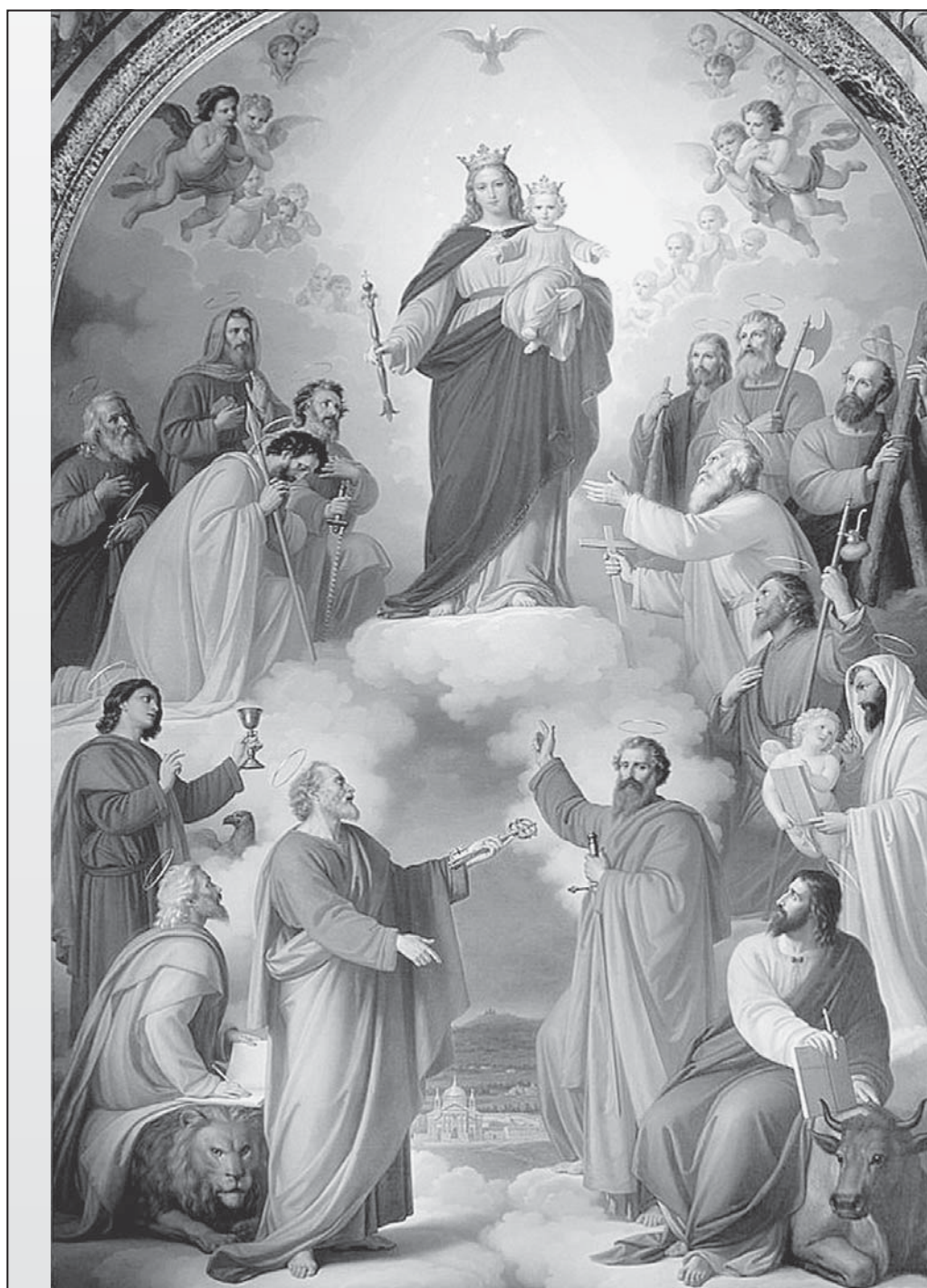
Panna Maria Pomocnice křesťanů (bazilika Panny Marie Pomocnice křesťanů, Turín)