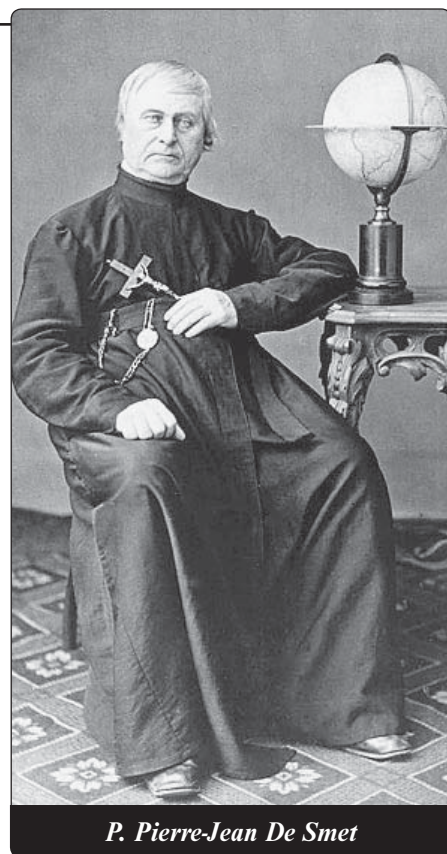
P. Pierre-Jean De Smet

V roce 1839 se dostavilo více delegací Flatheadů (Ploskolebců) k misijní stanici sv. Josefa, aby poprosily „Černé oděvy“, aby k nim přišli. Našemu misionáři se podařilo jejich náčelníky přesvědčit, a tak mohl vyhovět volání 2000 lidí, kteří vlastně už tehdy žili příkladným životem. Vyrazil