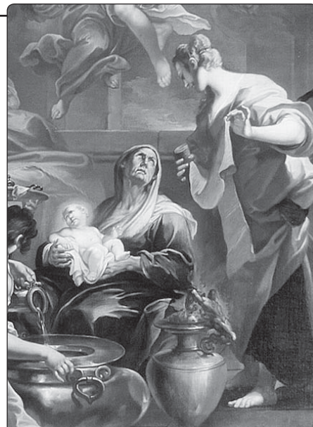
Filippo Abbiati (1640–1715): Narození Panny Marie, detail

Mimo vážnost teologů máme dva pádné a přesvědčivé důvody, dokazující tuto nauku.