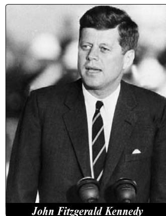
John Fitzgerald Kennedy