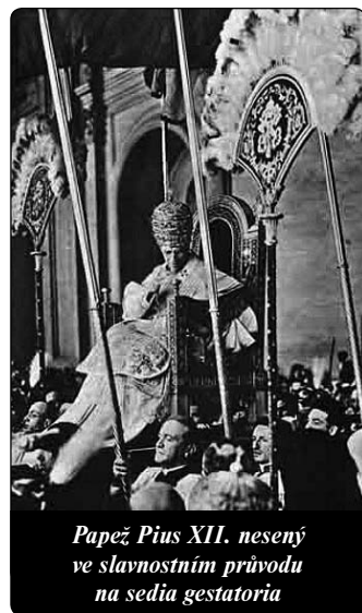
Papež Pius XII. nesený ve slavnostním průvodu na sedla gestatoria

Co se stalo za méně než deset let? Jak se mohl stát populární papež ničemnou postavou, která po sobě zanechala tíživé dědictví? Revizionistický proces proti Piu XII. jak známo má svůj počátek ve hře Rolfa Hochhuta „Náměstek“, publikované v roce 1963 v politickém divadle Ervina Piscatora. Matka Pascalina napovídá, že část dokumentace pochází od německého pronacistického preláta Mons. Aloise Hudala, kterého Pius XII. degradoval. Jiní myslí na dokumentaci opatřenou jiným nevěrným představitelem Svatého stolce. Insceance „Náměstka“ na Broadwayi počátkem roku 1964 otevřela debatu ve Spojených státech. Ale takřka všechny židovské organizace, především Antidifamation League a American Jewish Committee byly na jiné straně vlny: dívaly se se zájmem na změnu, jakou II. vatikánský koncil přinesl do vztahů k Židům. Dokonce odborný představitel Li-