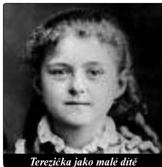
Terezička jako malé dítě

V posledních týdnech a dnech se nemocná modlila krátkou stělnou modlitbu: „Ty, která ses na mě přišla v úsvitu mého života usmát, přijď