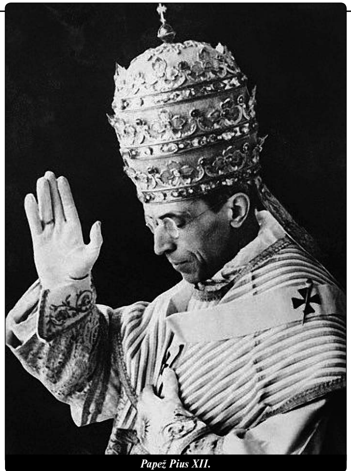
Papež Pius XII.

gy připravil brožuru, která hájila papeže, pro National Catholic Welfare Committee; Turné „Náměstka“ po USA bylo zrušeno. Ovšem v průběhu několika let doznalo i židovské mínění významných změn.