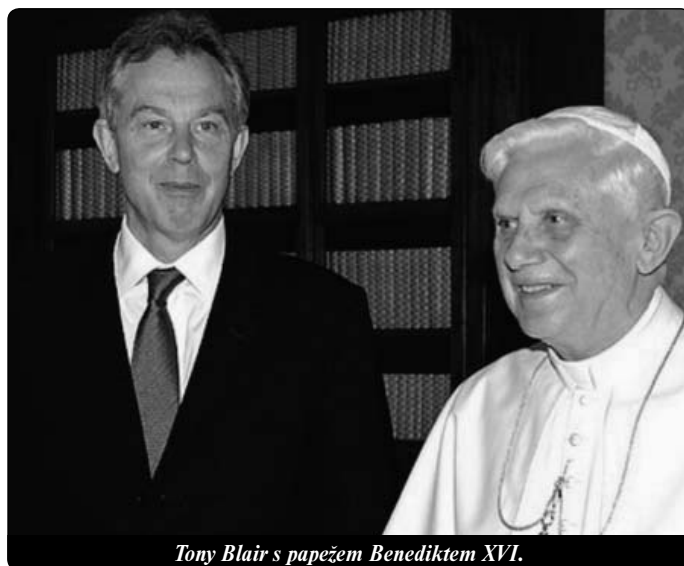
Tony Blair s papežem Benediktem XVI.