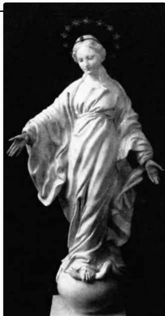
Před touto sochou Panny Marie byla sv. Terezie z Lisieux zázračně uzdravena

Zdá se, že Matka Boží udělila tehdy svému miláčkovvi ještě další milosti anebo jí svěřila zvláštní tajemství, které Terezii od té chvíle tížilo. Nikdo neví, o co se vlastně jednalo. V její autobiografii čteme: „Vzpomínka na tuto nevýslovnou milost byla pro mne po čtyři roky zvláštním duševním trápením. Teprve u nohou Panny Marie Vítězné v Paříži jsem opět našla své štěstí. Bylo mi tam navraceno v plné míře.“