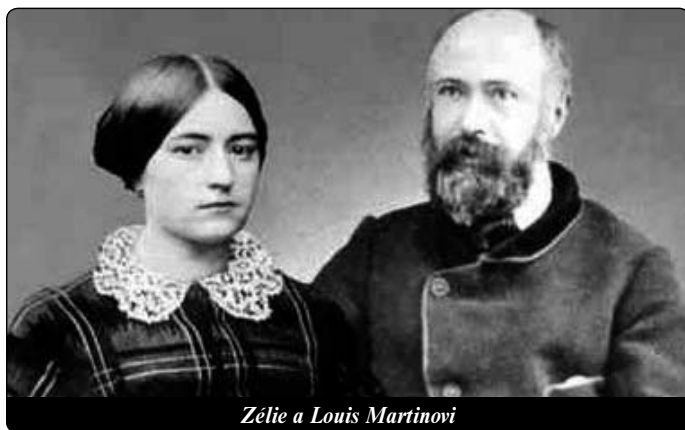
Zélie a Louis Martinovi

Po smrti otce Louise Martina přišla socha do Karmelu v Lisieux, do kláštera Terezie a jejích sester. Sestra Terezie od svatého Augustina si na to mohla později přesně vzpomenout, když napsala: „Terezie něžně milovala svatou Pannu. Když byla socha, která se na ni v dětské nemoci usmála, přinesena do kláštera, nemohla ji žádná sestra unést, byla pro ně příliš těžká. – Pro mne není těžká, – řekla služebnice Boží a s rozmachem, ze kterého bylo možno vyčíst rozpoložení jejího srdce, chytila sochu a odnesla ji až do oratoře, kde měla vyhlédnuté místo“ (Protokoly svatořečení s. 371).