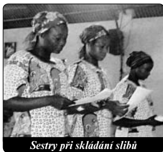
Sestry při skládání stibů

Ale protože v chatrčích panuje hlad, přizívuje se často celá rodina. Když dítě dosáhne dostatečné váhy, začne zase dieta, aby zchudlo a nový přírůstek pomohl celé rodině. Vidíš, jak velká bída zde panuje , vysvětluje ustaraná představená. Ale 300 dětí již přibralo, také těhotné ženy dostávají potravu na 14 dní. Když jsme matky s dětmi poprvé pozvaly, byly matky tak netrpělivé, že nám chtěly hodit děti dovnitř oknem. Při druhém vydávání povolíly jednu zed'.