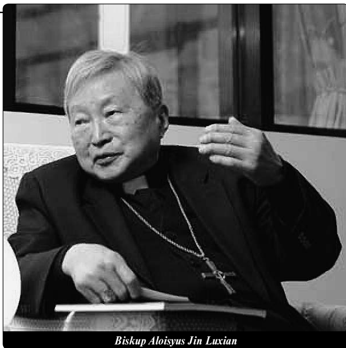
Biskup Aloisius Jin Luxian

Pán nám řekl, abychom se nebáli. Také Jan Pavel II. nám vždy říkal: – Nebojte se! A my se nebojíme.