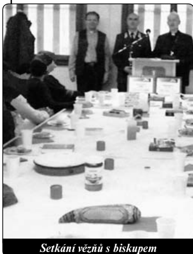
Setkání vězňů s biskupem