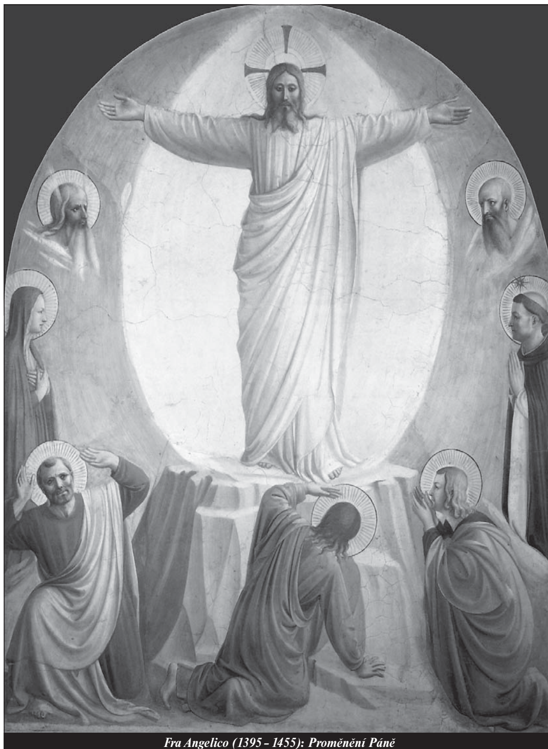
Fra Angelico (1395 - 1455): Proměnění Páně