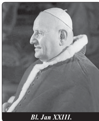
Bl. Jan XXIII.

Velký světec, velice populární v Itálii v 15. století, sv. Bernar-