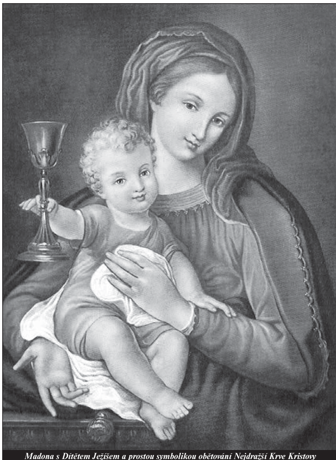
Madona s Dítětem Ježíšem a prostou symbolikou obětování Nejdražší Krve Kristovy