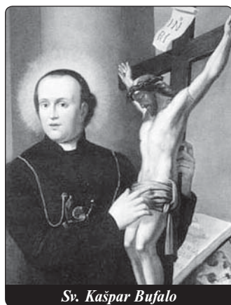
Sv. Kašpar Bufalo