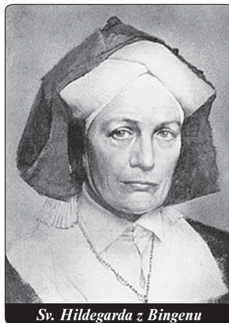
Sv. Hildegarda z Bingenu

a dalších měst. O sedm let později kázala mezi jiným v Maulbronnu a Hirsau. Bylo to neslýchané, protože laici měli kázání zakázána a benediktinská řehole umožňovala opustit klášter jen výjimečně.