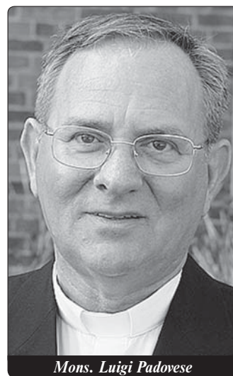
Mons. Luigi Padovese

„Obě náboženství dělí obrovská vzdálenost. Nejprve je třeba vědět, že islám se považuje