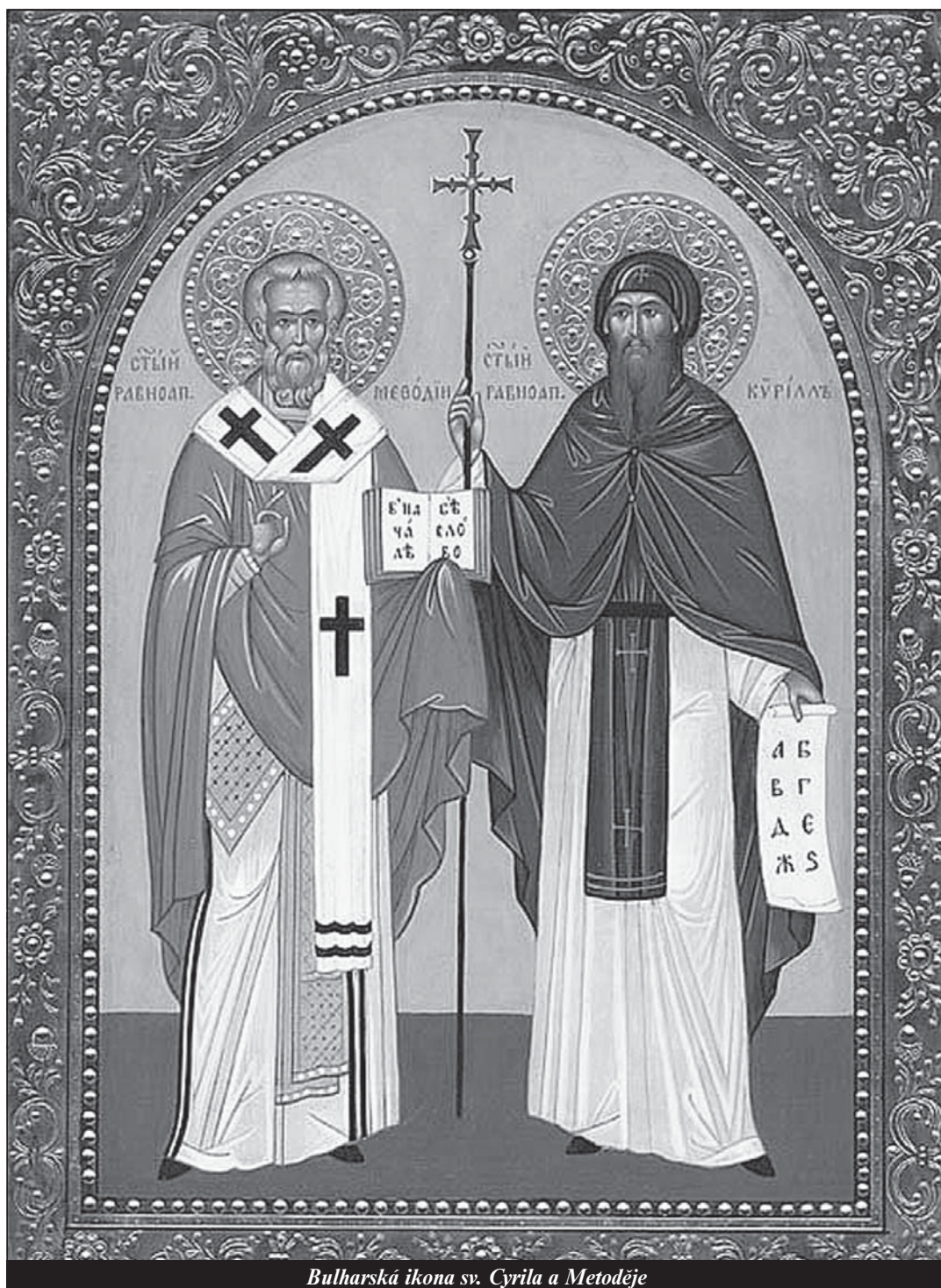
Bulharská ikona sv. Cyrila a Metoděje