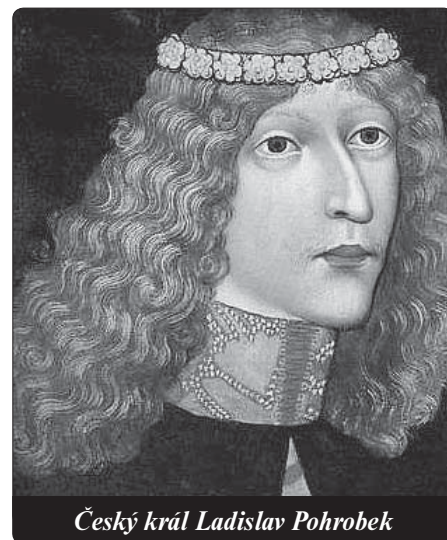
Český král Ladislav Pohrobek

Až do pobělohorského návratu národa do katolické církve český lid i zemské elity byly rozděleny na kališnickou (později protestantskou) a katolickou část. Konzervativní husité byli během 16. století postupně zatlačováni do pozadí silící protestantskou luteránskou konfesí, resp. Jednotou bratrskou. Epilogem kališnického hnutí byl rok 1609, kdy vydáním Rudolfova majestátu nastal nekontrolovatelný růst protestantismu. Dokument vydala protestantům dolní konzistoř s právem světit evangelické kněze. Pod jejich správou přešla i univerzita. Uvolnila se také pravidla pro stavbu protestantských kostelů nejen v královských městech, ale i na královských statcích. Vlivem průbojného luteránství se členové kališnické staroutravistické obce částečně rozplynuli v novém německém luteránském hnutí. Většinou však zbývající konzervativní kališníci, skuteční potomci husitů, splynuli s katolickou církví, k níž měli logicky nejbližší. A tak můžeme říci, že skuteční následovníci mistra Jana Hu-