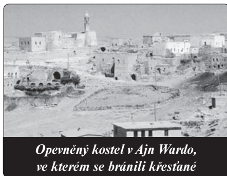
Opevněný kostel v Ajn Wardo, ve kterém se bránili křesťané

Po věky představoval Tur Abdin ve světovém měřítku unikátní oblast. Jeho obyvatelé používali každodenně dialekt aramejského jazyka, který byl blízký jazyku Ježíše Krista i apoštolů, a v převážné většině patřili k syrské pravoslavné církvi Antiochie. Nelze nepřipomenout