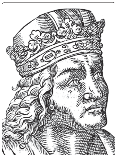
Český král Albrecht II. Habsburský

Důkazem toho, že konflikt nebyl zahájen, ale jen utlumen, byly konfrontace mezi katolickými a kališnickými teology a záhy také nový, či obnovený odboj. Královská armáda oblehla Hradec Králové, který se proti Zikmundovi vzbouřil. Roku 1437 byl v Praze popraven odbojný husitský hejtman Jan Roháč z Dubé, jehož hrad Sion byl předtím dobyt. Ve východních Čechách se zorganizovalo hu-