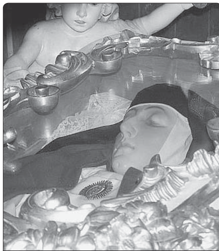
Marie od Ježíše z Agredy (1602-1665)

482. Nebeská Královna také pochopila ve zvláštní vizi, jak je nejsvětější Kristovo tělo skryté pod způsoby chleba a vína, aniž by se změnily způsoby nebo se nějak proměnilo nejsvětější Kristovo člověčenství, protože tělo nemůže být proměněno ve způsoby, ani způsoby nemohou nabýt