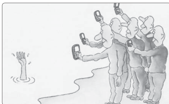
Když médium zatemňuje pohled na bližního...

ky musí být dávka vystupňována, protože konzument už skoro všechno viděl. A bude zvýšena a konzument si zvykne na nejstrašnější vyličení. Na nejkruťější skutky násilí, skandální sexuální scény.