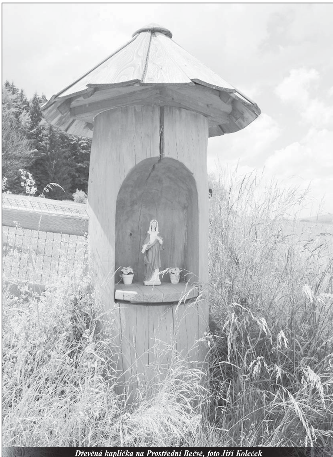
Dřevěná kaplička na Prostřední Bečvě

Tajemství zjevení v Tre Fontane (57) - strana 13 -