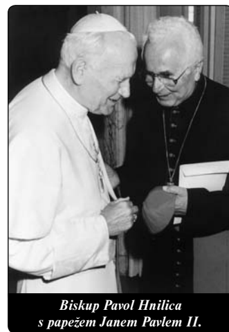
Biskup Pavol Hnilica s papežem Janem Pavlem II.

protože komise, která vizionáře vyšetřovala, tehdy prohlásila: „Non constat de supernaturalitate.“ (Není možno potvrdit nadpřirozený charakter.) Papež však již dávno rozpoznal, že se v Medjugorje dějí nadpřirozené věci. Papež se mohl z vyprávění různých lidí přesvědčit, že na tomto místě dochází k setkání s Bohem.