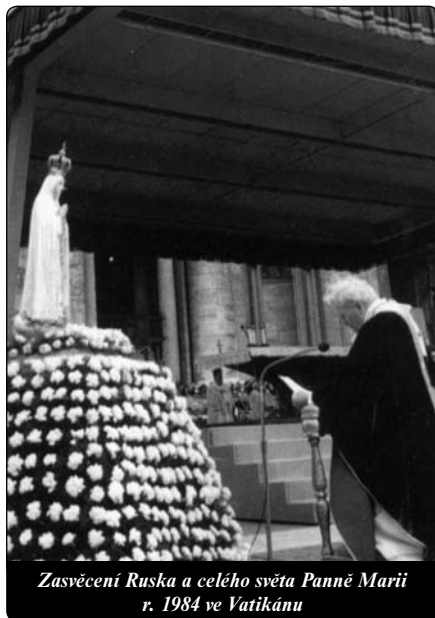
Zasvěcení Ruska a celého světa Panně Marii r. 1984 ve Vatikánu

Já to vidím pozitivně, neboť z toho můžeme poznat, že lidé, které si Panna Maria vyvolila, jsou prostě Boží nástroje. Oni