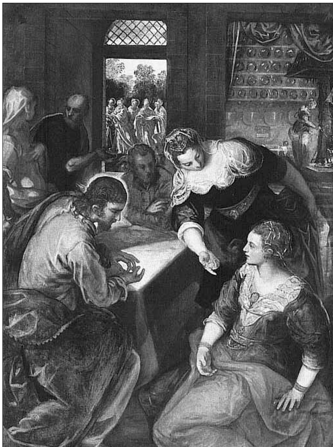
Tintoretto, r. 1567: Ježíš a sestry Marie a Marta, Monaco, Stará pinotéka