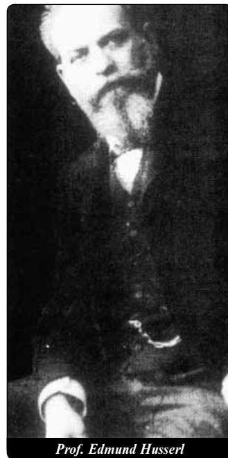
Prof. Edmund Husserl