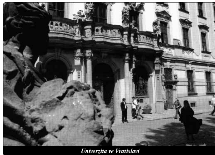
Univerzita ve Vratislavi