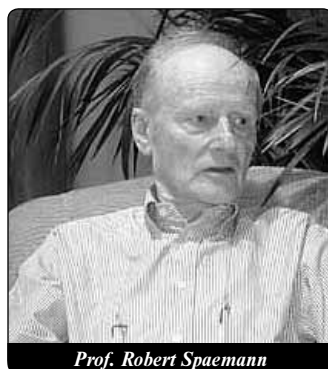
Prof. Robert Spaemann

by měla nová liturgie být demokratičtější než ta stará. I to, že kněz stojí v nové mši čelem k lidu, místo aby se spolu s lidem díval jedním směrem, se ideolo-