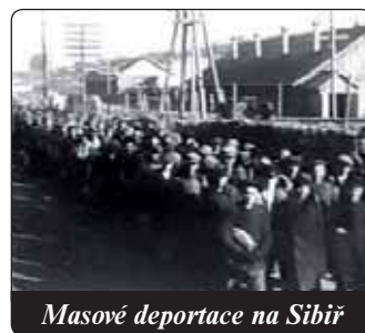
Masové deportace na Sibir

Před 90 lety se stala skutečností idea, kte- rá představuje největ- ší zločin v lidských dějinách: komunismus. Kolem 100 milio- nů lidských obětí si vyžádalo to, co začalo tzv. říjnovou revolucí.