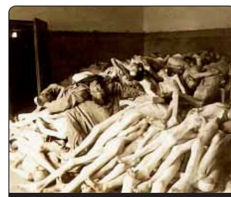
Proklamovaný „spravedlivý světový řád“ provázely hromady mrtvol

Po první vlně vraždění před devadesáti lety následovalo o dvacet let později další vraž- dění nazvané „Velký teror“. Jen v Moskvě bylo zastřeleno 40 000 lidí, nejméně 700 000 v dalších městech. Někteří pamětníci ješ- tě žijí. Již před systematickým vyhlazováním Židů v Německu počínaje rokem 1942 existovalo v Sovětském svazu systematické ničení vlastního obyvatelstva, při kterém se „vraždilo podle kvót, které byly pro jednotlivé oblasti určeny v Moskvě“ (FAZ 31. říj-