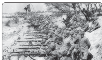
Isonza v květnu 1917

na slíbila konec války, ale stano- vila podmínku: pokud hříšníci nepřestanou urážet Pána, začne ještě horší válka.