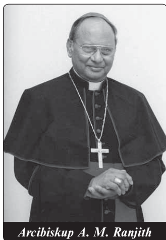
Arcibiskup A. M. Ranjith

tože respektuje Pánovu svobodu, aby nás vedl k hlubšímu pochopení zjevené pravdy i tím, co se stane v budoucnosti. Přirozeně skrze učitelský úřad Církve musí dojít také k rozlišování toho, co z těchto pólů vyplývá. Na čem však je třeba pevně trvat, je význam, který připadá