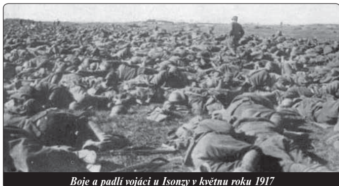
Boje a padlí vojáci u Isonzy v květnu roku 1917