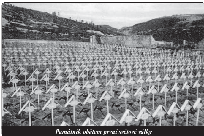
Památník obětem první světové války

Benedikt XV. píše: „Pane kardinále, 27. dubna 1915 jsme rozšířili na všechny ty, kteří zasvětili své domovy Nejsvětějšímu Srdci Ježíšovu, časné odpustky v trvání dvou let, které udělil náš předchůdce blahé paměti Pius X. rodinám v Chile. Osvěcovala nás tedy živá a jasná důvěra, že božský Vykupitel, povoláný,