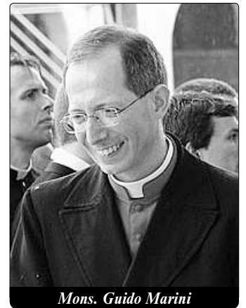
Mons. Guido Marini

Takzvaný trůn, užívaný při zvláštních příležitostech, chce jednoduše zdůraznit liturgické předsednictví papeže, Petrova nástupce a Kristova náměstka. Pokud jde o umístění kříže do středu oltáře, ukazuje se tím na ústřední postavení krucifixu při slavení eucharistie . Při ní nejde o podívanou, ale o pohled na