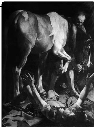
Michelangelo da Caravaggio: Obrácení sv. Pavla (1600-1601)

všichni máme účast na jednom chlebě (1 Kor 10,16n). Těmito slovy se obrací k nám v tuto hodinu nejen Pavel, ale sám Pán. Jak jste mohli roztrhnout mé tělo? Před Kristovou tváří se toto slovo stává současně naléhavým požadavkem: Svádí nás dohromady ze všech rozdělení. Usiluje o to, aby se to dnes stalo novou skutečností: Jako je jeden chléb, i když je nás mnoho, tvoříme jedno tělo. Pro Pavla není slovo o Církvi jako o Kristově těle jen nějakým přirovnáním. Jde za všechna přirovnání. „Proč mě pronásleduješ?“ Kristus nás ustavičně vtahuje do svého těla, buduje své tělo počínaje eucharistickým středem, který je pro Pavla středem křesťanského života. V jeho síle všichni i jeden každý může zakusit zcela osobním způsobem: On mě miloval a za mne se obětoval.