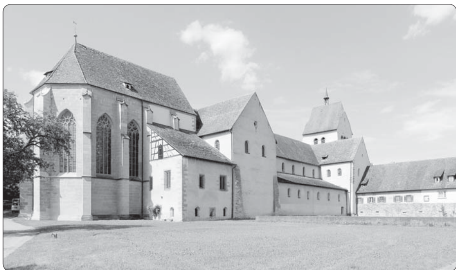
Opatství Panny Marie a sv. Marka na ostrově Reichenau

Byla pro něho skutečně Matkou, jak to sám vyjádřil v Salve Regina nepřekonatelně intenzivními slovy: „Zdravas Královno, Matko milosrdenství, živote, sladkosti a naděje naše, buď zdráva! K tobě voláme, vyhnání synové Evy, k tobě vzdycháme, lkající a plačící v tomto slzavém údolí. A proto, orodovnice naše, obrať k nám své milosrdné oči a Ježíše, požehnaný plod života svého, nám po tomto putování ukaž.“