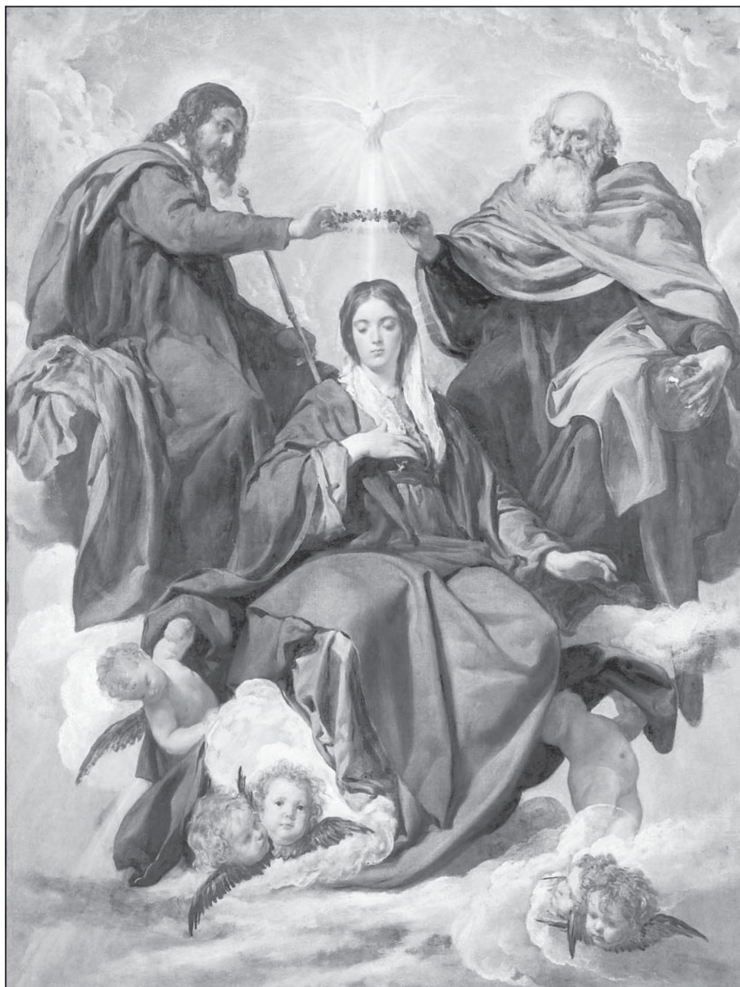
Diego Rodríguez de Silva y Velázquez (1599 – 1660): Korunování Panny Marie

Vizionář: Tajemství zjevení v Tre Fontane (68) - strana 12 -