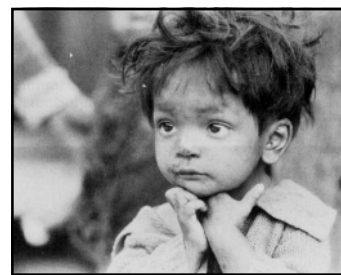
Nejtěživěji doléhá ztráta domova na bezbranné děti

Nakonec si uvědomme, že jsme vlastně všichni poutníky na této zemi a že všichni společně hledáme svou pravou vlast v nebi... O