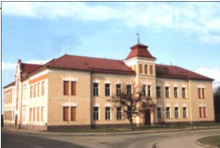
Biskupské gymnázium v Ostravě (foto k článku na str. 24)