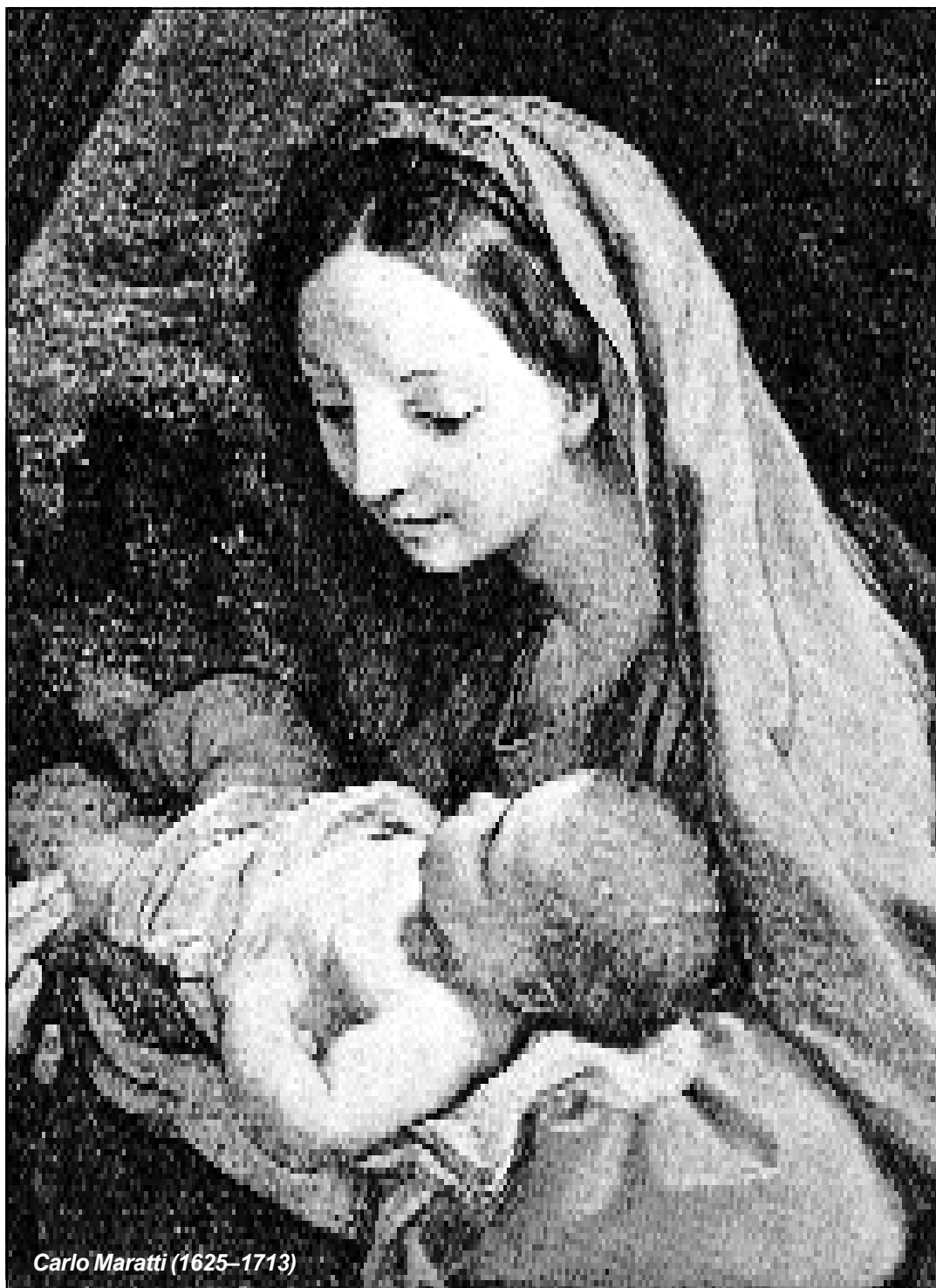
Carlo Maratti (1625–1713)

Redakce týdeníku Světlo přeje svým čtenářům a jejich rodinám milostiplné vánoční svátky, radost a pokoj od narozeného Krista, našeho Spasitele.