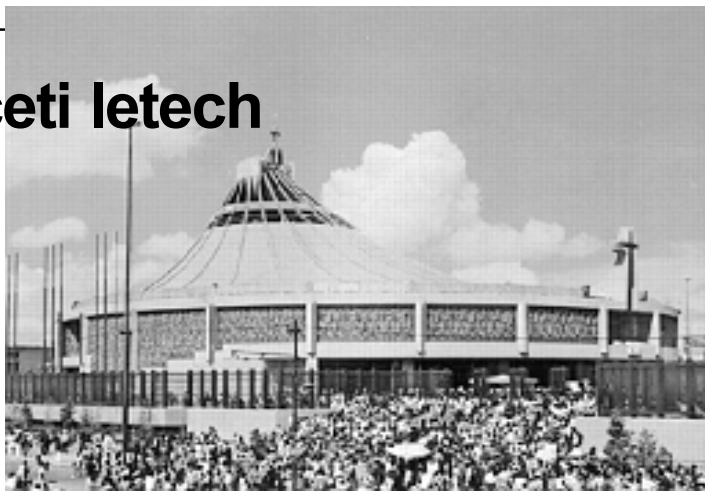
Návštěva poutní svatyně Panny Marie Guadeloupské byla vrcholným bodem papežovy poutní cesty do Mexika a Spojených států.

Důležitým duchovním centrem je poutní svatyně Panny Marie Guadeloupské. Návštěva této svatyně je také vrcholným bodem papežovy poutní cesty. Zde Jan Pavel II. uzavírá celomexický biskupský synod, který skončil v r. 1997 a k jehož výsledkům napsal apoštolský list Církev v Americe. List má 140 stran a týká se tří stěžejních otázek: obrácení, společenství a solidarita. Nekompromisními slovy v něm odsuzuje obchod s drogami, korupci, potraty a eutanázii, nenávisť vůči cizincům a porušování lidských práv.