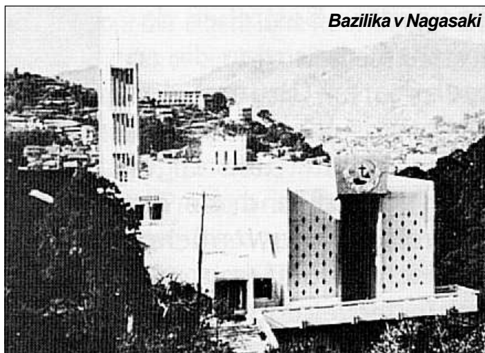
Bazilika v Nagasaki