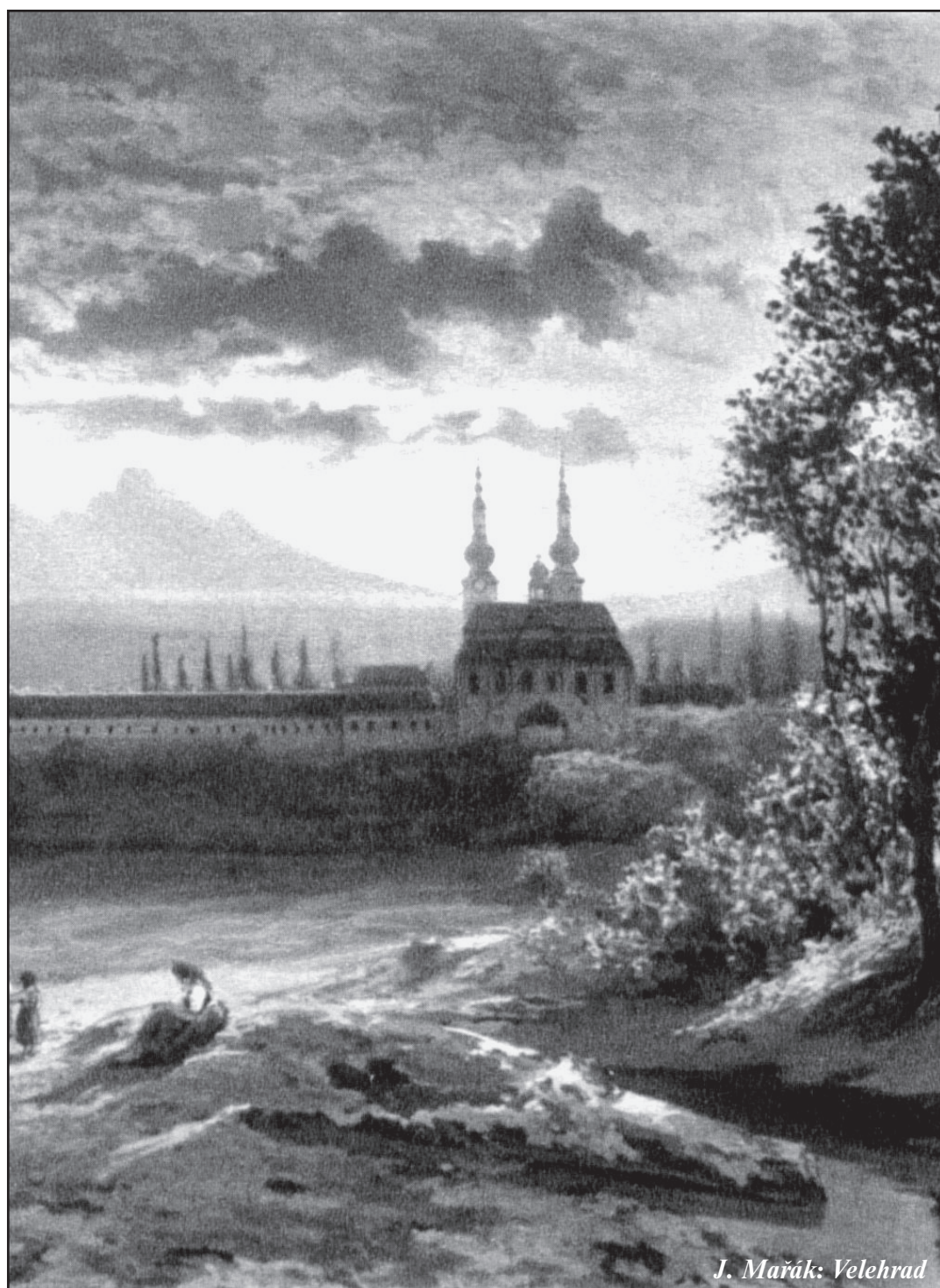
J. Mařák: Velehrad