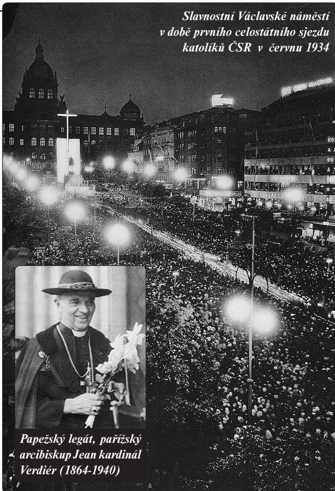
Papežský legát, pařížský arcibiskup Jean kardinál Verdiér (1864-1940)