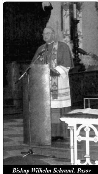
Biskup Wilhelm Schraml, Pasov

Milostí jsme to, co jsme; i Maria, tím, čím je a co vyzařuje. Neboť Bůh shlédł na ponížení své služebnice (Lk 1,48). V jásetu Magnificat je děkovaná odpověď na její vyvolení pro nás povzbuzením, že odhalujeme svou důstojnost jako lidí a Božích dětí a probouzíme ji stále znovu tím, že se obracíme k našemu milujícímu a odpouštějícímu Bohu. Neboť opravdu krásný člověk je jen ten, který miluje Boha z celého srdce a z celé duše (Lk 10,27).