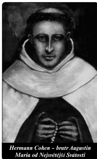
Hermann Cohen - bratr Augustin Maria od Nejsvětější Svátosti

ší Svátosti: Jsem dítě Nejsvětější Svátosti, bytost, která byla obnovena a přitahována touto propastí nejúctyhodějšího tajemství, která chce dýchat a žít skrze Ježíše v Hostii.