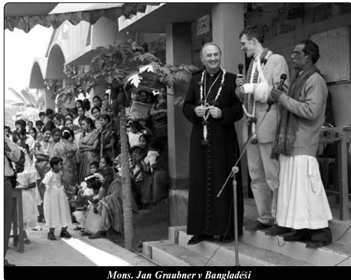
Mons. Jan Graubner v Bangladéši

Jakýmkoliv finančním darem pro misie v Bangladéši je možné připojit se k misijní sbírce, která se konala v kostelích, a zaslat na konto u ČSOB č.u. 377688503/0300, VS 91150, KS – pro složenkou 179, – pro převod z účtu na účet 558.