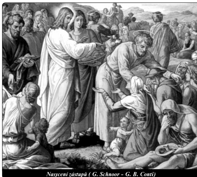
Nasyčení zástupů (G. Schnoor - G. B. Conti)