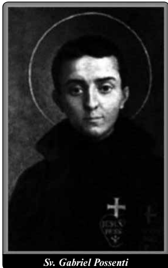
Sv. Gabriel Possenti

Gabriel byl až do konce svého života radostný. Nevyléčitelné souchotiny vysály až do krajnosti jeho křehký organismus. Blížil se konec jeho života. Lékař dělal, co mohl, aby jeho život prodloužil. Když viděl jeho nesmírný klid a pohodu, jeho