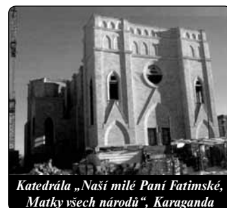
Katedrála „Naší milé Panny Fatimské, Matky všech národů“, Karaganda

Stavba svatyně „Naší milé Panny Fatimské, Matky všech národů“ pokračuje dobře. Začíná se montovat střecha. Stavební úřad uložil před nedávnem pro formální chybu při zaměstnávání dělníků pokutu ve výši několika tisíc eur. Byla to pokuta pro právnickou osobu. Když jsem v delším rozhovoru u vedoucího úřadu proti tomu protestoval, potrestal mě jako fyzickou osobu jen částkou 150 €. Řekl, že zcela bez pokuty už to nejde a jinak jednat nemohl. Řekl jsem mu: