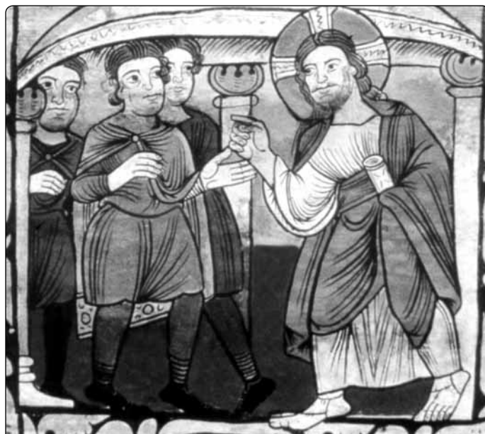
Ježíš učí v nazaretské synagoze (druhá polovina 12. stol.), sv. Martin, Zillis, Švýcarsko

Sotva stanul na pevnině, přišel k němu Jairo, představený synagogy, a prosí Ježíše: Moje dceruška umírá. Pojď a vlož na ni ruce! Cestou se kolem Ježíše tlačil velký zástup a byla zde také jedna těžce nemocná žena. Evangelista uvádí, že dala lékařům již celý svůj majetek, ale bylo jí čím dál hůř. Nikdo nebyl schopen ji uzdravit. Dokáže to Ježíš? Žena se k němu tajně přiblíží a dotkne se jeho pláště. Ihned je uzdravena. Ale Ježíš se ptá: Kdo se mne dotkl? Užaslí učedníci mu řeknou: Všichni se na tebe tlačí, a ptáš se, kdo se tě dotkl. Žena však uslyšela tuto řeč, přemohla strach a všechno mu pověděla. Ježíš nato: Tvá víra tě zachránila. Byla tedy nejen uzdravena, ale i zachráněna. Víra, která se