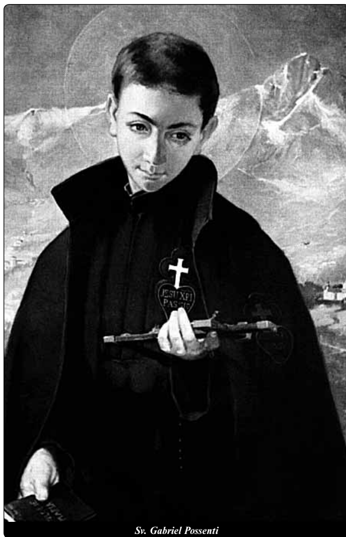
Sv. Gabriel Possenti

Mohl udělat velkou kariéru, ale i při vši jeho veselosti ho svědomí stále varovalo, že je na