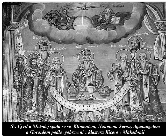
Sv. Cyril a Metoděj spolu se sv. Klimentem, Naumem, Sávou, Aganangelem a Gorazdem podle vyobrazení z kláštera Kicevo v Makedonii

Počet poutníků na Velehradě byl odhadován 5. července na 100 000, 12. července na 80 000 (Cinek, str. 175 a 183). Během roku 1863 prošlo Velehradem přes půl milionu poutníků (Kolísek, str. 91). Závěrečnou mši svatou na Velehradě sloužil arcibiskup Fürstenberg.