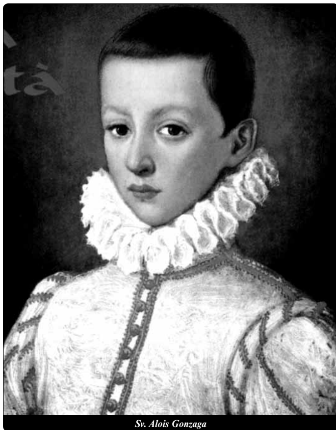
Sv. Alois Gonzaga

Dvorský svět mu připadal příliš těsný, tušil, že v sobě zahrnuje lidská i duchovní omezení a také velká nebezpečí, a tak v něm stále více dozrávalo rozhodnutí vzdát se svého prvorozenství. Nejdříve o tom hovořil s matkou, pak musel snášet posměšky příbuzných a nakonec nevyhnutelný, pochopitelný a přísný odpor otce. Ten si na Aloisovi velice zakládal. Chtěl ho učinit svým velkým dědicem a nástupcem. Byla zde jeho slibná inteligence, kultura a diplomatické schopnosti, které zcela scházely jeho mladšímu bratru. Vyhlídky, že se syn zřekne prvorozenství, velice otce hněvala. Když se vrátili v roce 1584 z Madridu, nařídil otec svým synům okružní