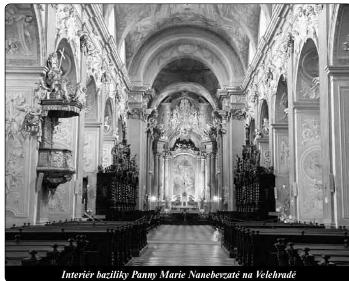
Interiér baziliky Panny Marie Nanebevzaté na Velehradě

V r. 1985 poslal Velehradu Zlatou růži. K 1100. výročí smrti sv. Metoděje ji přivezl dne 7. 7. 1985 na Velehrad delegát Svatého otce kardinál Agostino Casaroli. (Zlatou růži dostaly zatím mariánské svatyně: Guadalupe v Mexiku, Lurdy ve Francii, Čenstochová v Polsku a naše bazilika velehradská.)