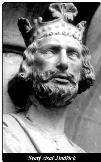
Svatý císař Jindřich

O Jindřichovi se říká, že byl cílevědomou osobností a mužem činu. Jelikož císař Otto III. nezanechal dědice, došlo po jeho smrti k velkému boji o jeho trůn. Boj skončil Jindřichovým vítězstvím. V červnu 1002 arci-