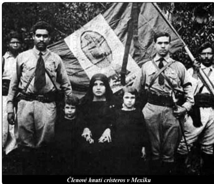
Členové hnutí cristeros v Mexiku

Když nastal okamžik volby jména pro kongregaci, kte-