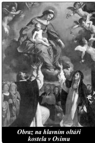
Obraz na hlavním oltáři kostela v Osimu

Ale nezastaví se jen u toho. Slovem i písmem se stává Ježíšovým apoštolem pro velký počet duší. Kolik to listů napsala nalevo, napravo, přátelům a známým, dělnicím i vzdělaným oso-