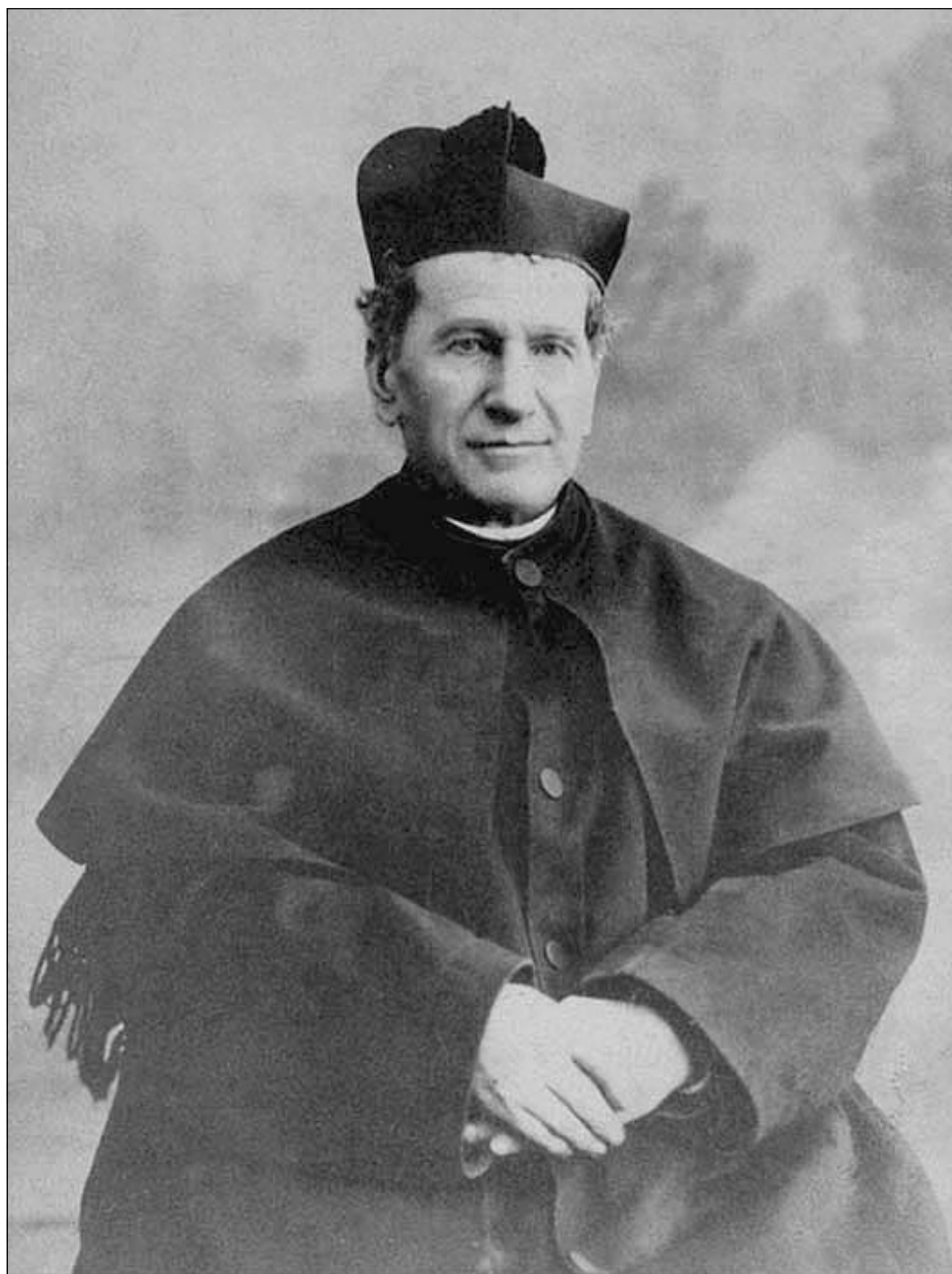
Sv. Jan Bosco, fotografie z roku 1878

Láska k Otci přijatá a rozvíjená v kněžském srdci - strana 11 -