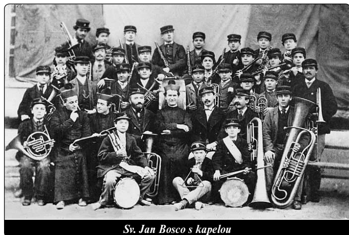
Sv. Jan Bosco s kapelou

Jiná epizoda je z léta 1854. V Turíně propukne cholera, jejíž epicentrum je v Borgo Dora, kde jsou nahromaděni přistěhovalci. Je to dva kroky od oratoře Dona Boska. V Janově již zemřely 3 000 obětí. V Turíně 800 nakažených a 500 mrtvých. Magistrát se obrací na město, ale nenachází dobrovolníky pro ošetřování ani pro transporty do lazaretu. Všech se zmocnila panika. 5. srpna na svátek Panny Marie Sněžné shromáždí Don Bosco své chlapce a slibuje: „Jestliže budete všichni v posvěcující milosti a nedopustíte se žádného těžkého hříchu, slibuji vám, že nikdo z vás neonemocní nákazou.“ A požádá je, aby se dali do služeb nemocným. Jsou ustaveny tři oddíly: starší hoši slouží v lazaretu a v domech. Menší sbírají umírající na ulicích a opuštěné nemocné v domech. Ti nejmenší jsou k dispozici při volání o rychlou pomoc. Každý dostane láhev s octem, aby si umyl ruce, které se dotkly nemocného. Město a úřady jsou ohromeny, včetně