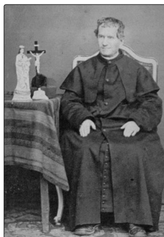
Sv. Jan Bosco, Turín 1878

Cotolengo (kněz nevléčitelně nemocných, který se pokládá za nádeníka Boží Prozřetelnosti). Ten jednou vzal do ruky Boskovu kleriku a řekl: „Je příliš lehká. Opatřete si odolnější, mnoho mladých se za ni pověsí!“