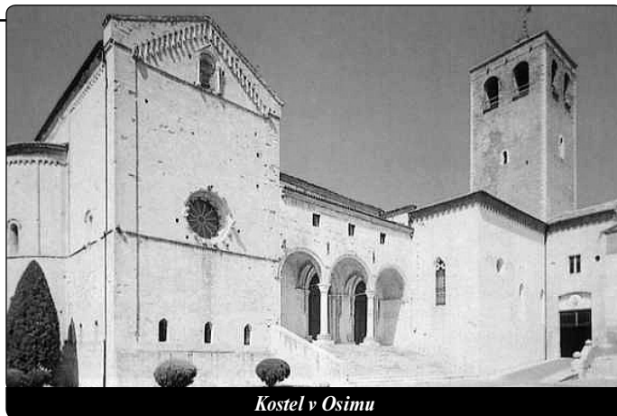
Kostel v Osimu

Ale to, co je neuvěřitelné, je dobro, které se šíří mimo domov, a to s minimálními prostředky, které má k dispozici. Desítkám a desítkám chudých