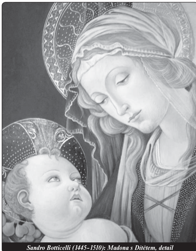
Sandro Botticelli (1445–1510): Madona s Dítětem, detail

Zastyd' se, pyšný popeli! Bůh se poníží, a ty se povyšuješ! Bůh se podřizuje člověku, a ty, kterému nestačí, že vládneš nad lidmi, jako jsi ty, jdeš tak daleko, že se chceš stavět proti svému Stvořiteli? Kdybych měl někdy zaujmout takový postoj, kéž by mi byla dopřána ta milost, aby mi Bůh řekl to, co jednou s výtkou pověděl svému apoštolu: Odejdi ode mne, sata-