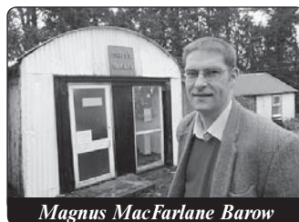
Magnus MacFarlane Barow

Čím více čtu, slyším, vidím na DVD o „Mary's Meals“ (Jídlo od Marie) pro děti v Malawi a ve 13 dalších zemích, tím více jsem nadšená a tím více úcty chovám k iniciátorovi, Skotu jménem Magnus MacFarlane Barow. Poprvé jsem ho slyšela v kostele Panny Marie ve Vídni, kde mluvil o svém projektu. V kostele bylo zima, ale při jeho slovech mi bylo u srdce velice teplo, i když to zní kýčovitě. Po druhém setkání při jedné tiskové konferenci, na které bylo bohužel velmi málo zástupců sdělovacích prostředků, jsem měla příležitost hovořit s ním o jeho projektu. Je vysoký, vypadá velmi rozhodně, má smysl pro humor a je velmi angažovaný. Takový byl můj první dojem. Tento dojem se potvrdil v Radiu Maria, kde jsme se jednou setkali.