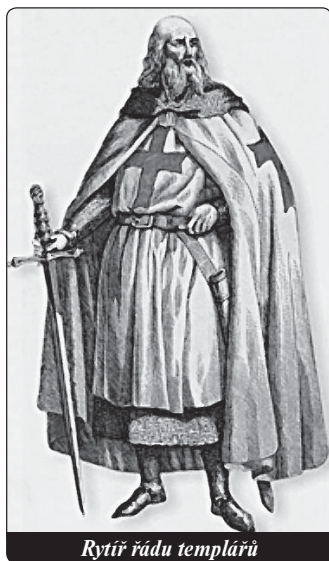
Rytíř řádu templářů

Wilson srovnal velké množství svědectví, která templáři zanechali během procesu, a poukázal, že mezi obviněními, která