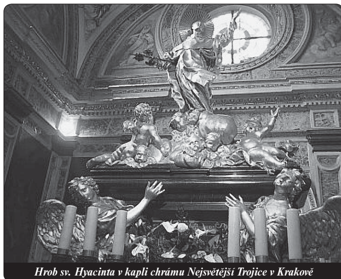
Hrob sv. Hyacinta v kapli chrámu Nejsvětější Trojice v Krakově

Odpočívá v kapli chrámu Nejsvětější Trojice v Krakově. V roce 1527 ho papež Klement VII. prohlásil za blahoslaveného a jeho nástupce Klement VIII. ho v roce 1594 zapsal do seznamu svatých. Napsal o něm přitom