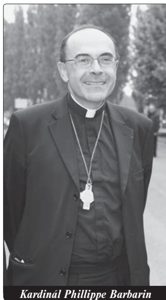
Kardinál Philippe Barbarin

Není sporu, že kdo evangelizuje, nemá vždy čisté srdce. Kdo se cítí spíše jako dobyvatel a nikoliv jako služebník, nepředá své poselství, protože pýcha všechno zkazí. Navíc musí stále na své víře „pracovat“. „Jako