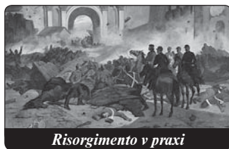
Risorgimento v praxi

katolickým institucím. V protestantských státech jako Německo a Velká Británie i USA byly v polovině 19. století pořádány propagační kampaně proti církevnímu státu a katolické církvi. Tak otevřeně se savojský stát, který později dobyl zbraněmi a násilím jednotu Itálie, proti církvi