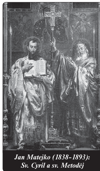
Jan Matejko (1838-1893): Sv. Cyril a sv. Metoděj