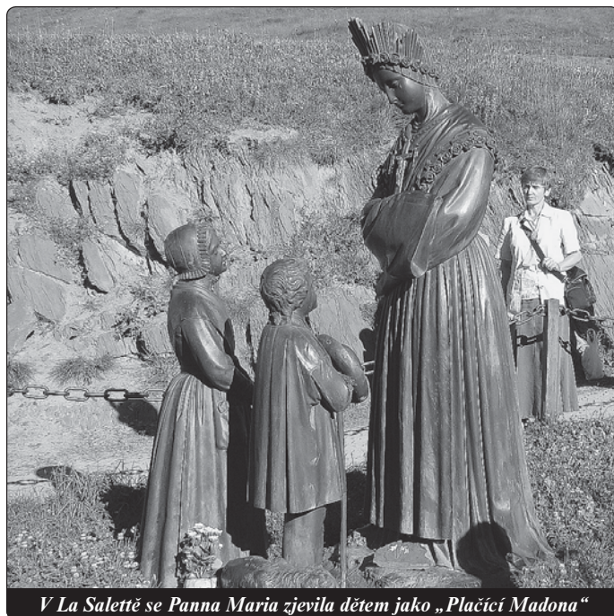
V La Salettě se Panna Maria zjevila dětem jako „Plačící Madona“