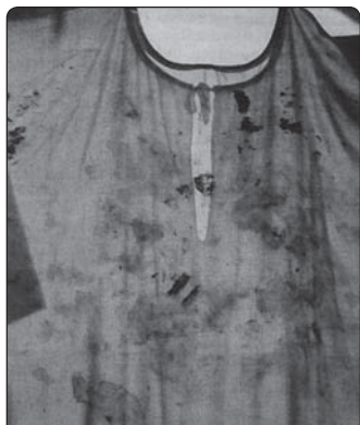
Noční košile, kterou nosil P. Pio, je celá pokryta krvavými skvrnami

aplikovat i na P. Pia, který měl díky svým stigmatům účast na Ježíšově umučení, a tak skutečně proléval svou krev za obrácení Alberta Del Fante a za všechny svoje duchovní děti, kterých bylo 14 milionů.