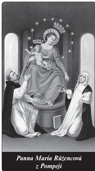
Panna Maria Růžencová z Pompejí

hry na kytaru. Po několika měsících mě moji přátelé „postrčili“ dopředu: pozvali mě na svoje růžencové setkání. I když jsem o modlitbě jako takové a o růženci vůbec neměl potuchy, přijal jsem pozvání. Sám jsem tomu pak nechtěl věřit, že jsem mezi mladými odřikával jeden Zdravas za druhým. Byl to první růženec v mém životě. Jedno děvče mi potom darovalo svůj hezký růženec a já jsem si tuto modlitbu oblíbil. Růženec a s ním Panna Maria se stali mými neodmyslitelnými společníky i v modlitební skupině i na cestě do školy nebo na trénink a já jsem Pannu Marii vni-