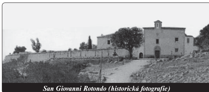
San Giovanni Rotondo (historická fotografie)

Při těch slovech jsem cítil, jako by mi ostrá čepel rozřezala srdce na dvě části. Byl jsem sklí-