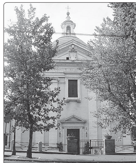
Kostel svatých Marcelína a Petra v Lateránu, dnes titulární kostel kardinála Dominika Duky

ti, kterou nejenom prožíváme, ale kterou spoluvytváříme. »Ježíš, ne císař!« v době nejkřutější okupace naší země volal z londýnského exilu na vlnách britského rozhlasu ministr zahraničí Jan Masaryk, který zaplatil svým životem na počátku nové temné a potupné poroby, kterou nám připomene výstava o pronásledování církve v době komunismu v naší zemi, jež bu-