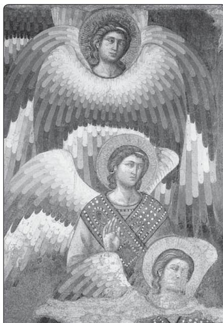
Pietro Cavallini (1259–kolem 1330): Archanděl, detail obrazu Posledního soudu z kostela Santa Maria in Trastevere, Řím

• Konečně, poslední důvod pro to, proč se svět andělů sjednocuje se světem lidí, je ten, že Ježíš založil bohoslužbu Nové úmluvy, tj. samotnou nebeskou liturgii, které se účastní jak andělé, tak lidé; andělé ve světle vidění, věřící pod závojem symbolů. Ale pod tímto závojem se jedná o stejnou bohoslužbu, o stejnou adoraci, o stejnou přítomnost. Je to proto, že křesťané a andělé se budou spojovat ve svaté liturgie až do konce světa.