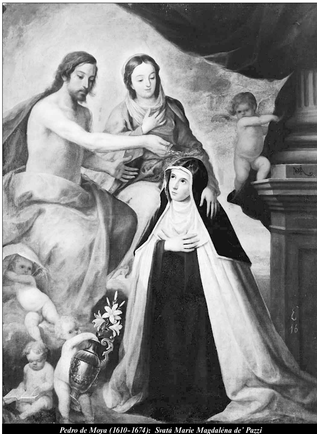
Pedro de Moya (1610-1674): Svatá Marie Magdaléna de' Pazzi