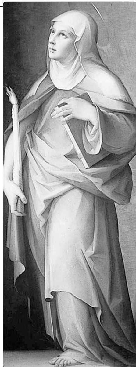
Svatá Brigita Švédská

V roce 1342 po vzoru svého otce putovala do Santiaga de Compostela. Vydala se tam se svým manželem, jenž však na zpáteční cestě roku 1344 zemřel. Krátce předtím stihl vstoupit v Alvastře k cisterciákům, kde už žil jejich syn Benedikt. Ovdovělá Brigita začala novou kapitolu svého života.