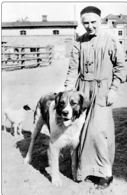
„Co sešle Bůh, je pro nás vždycky dobré.“

Ať je svaté přijímání středobodem, osou, kolem níž se budou vaše životy otáčet. Nejdůležitějším okamžikem dne je okamžik svatého přijímání, okamžik, v němž Bůh a váš Pán přichází znovu vzít do svého vlastnictví vaše ubohá srdce. Ať jsou doširoka otevřená pro velkého Pána – oprostěná od všech pozemských pocitů, od znechucení, ambicí, pozemských starostí a myšlenek. Ať ve vás vše umlkně, ať hovoří Pán, ať vše řídí a kraluje, ať ve vás žije on a jedině on.