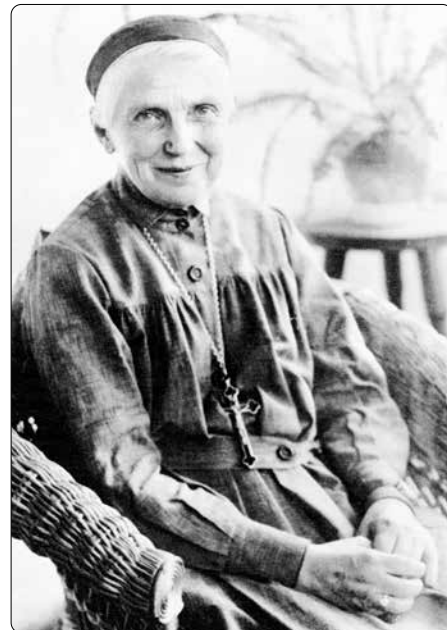
Svatá Uršula Ledochowská

Když potom klečíš před svatostánkem a nevíš, na co máš myslet, myšlenky ti odbíhají, pokať se v takovéto chvíli před Pánem co možná nejvíce. Ano, pěkně potichu lež před paprsky eucharistického Slunce. Třebaže se ti bude zdát, že nic nedělaš, čekej a doufej – Ježíš sám ve tvé duši působí, proto od Ježíše neutíkej!