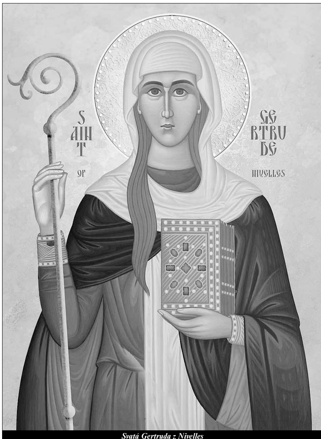
Svatá Gertruda z Nivelles