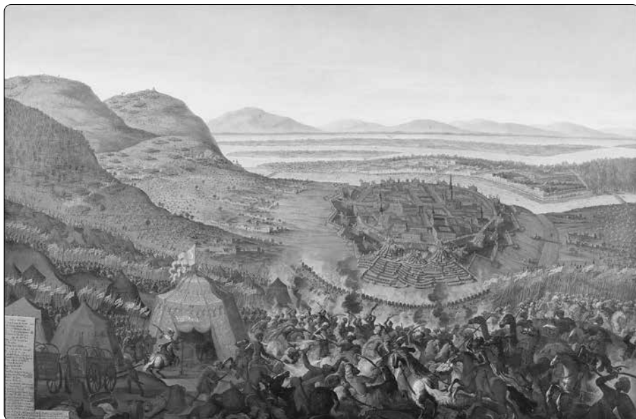
Franz Geffels (1625-1694): Obléhání Vídne Turky, 1683

Stalo se, jak mnich předpověděl: Sotva přešel rok – a turecké vojsko „tak veliké, jaké nikdo nikdy neviděl“, se převálilo přes Balkán k severu. Začalo dvouměsíční obléhání Vídne. Císař utekl do Lince a nechal povolát „zázračného mnicha“ z Itálie. Ten přednesl na tullnské rovině 8. září 1683 (o svátku Narození Panny Marie) spojeným vojskům pod vedením polského krále svoje ohnivé kázání: „Bez Boha