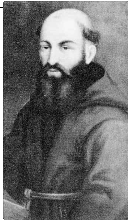
Bl. Marek z Aviana

Od tohoto dne se množila hlášení o zázračných uzdraveních. P. Marek neměl ani hodinu klidu: adventní a postní kázání, slavnostní a příležitostná kázání, nejprve v severní Itálii, potom také v německy a francouzsky mluvících zemích. Jeho slova byla doprovázena zázračnými uzdraveními.