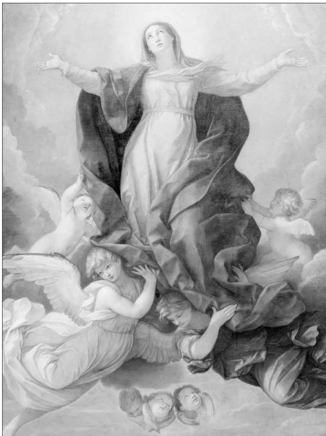
Guido Reni (1575-1642): Nanebevzetí Panny Marie