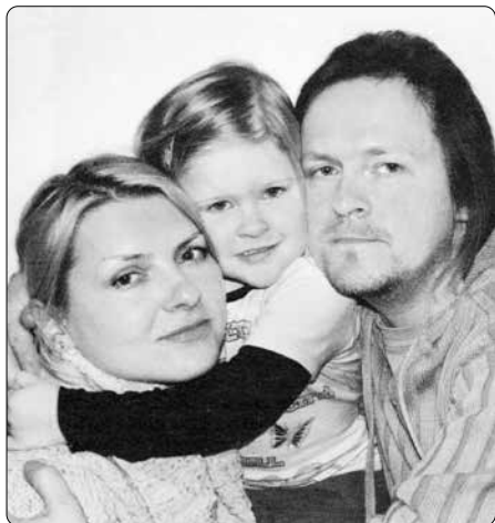
Maruščino narození pro nás bylo opravdovým zázrakem

Nakonec skončila v nemocnici na oddělení dětské gastroenterologie a metabolických nemocí. Ani tam však nedokázal