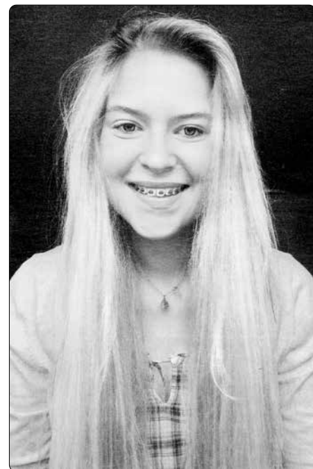
Dnes je Maruška zdravá, studuje a je členkou mládežnických společenství

Z Trwajcie w miłości 1/2023 přeložil -lr- (Redakčně upraveno)