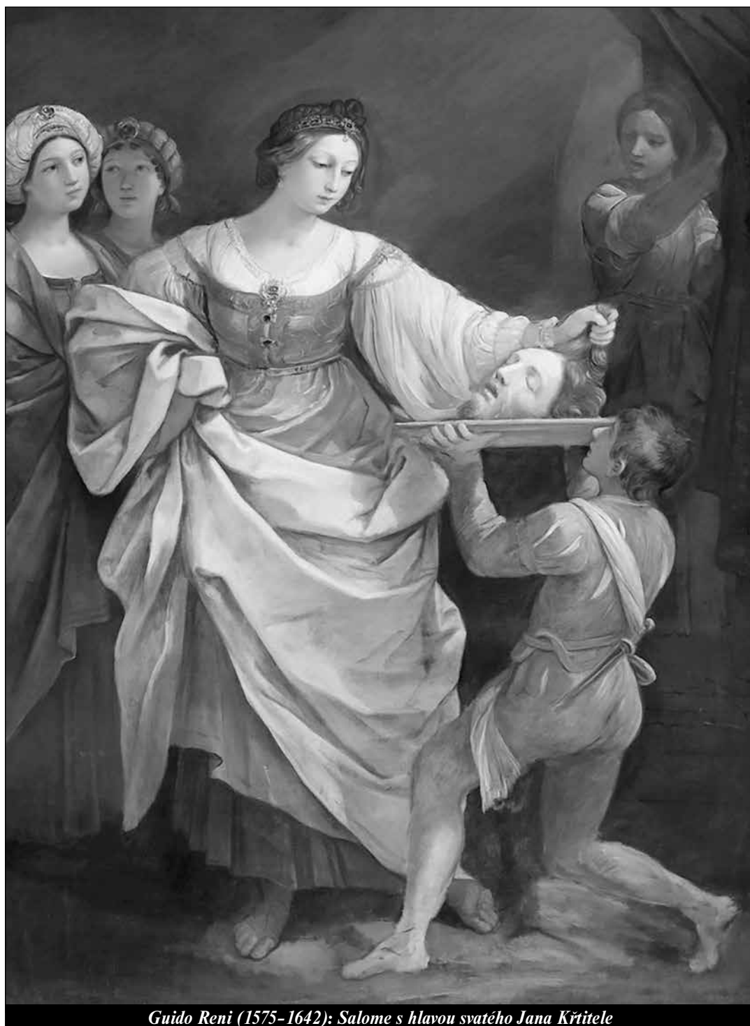
Guido Reni (1575-1642): Salome s hlavou svatého Jana Křtitele