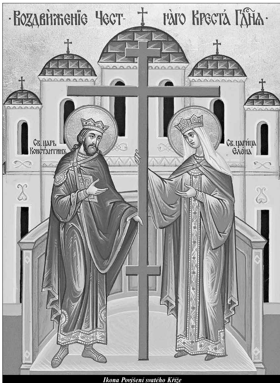
Ikona Povýšení svatého Kříže

vzor mládeže (3) Koloman Grieger SJ - strana 12 -