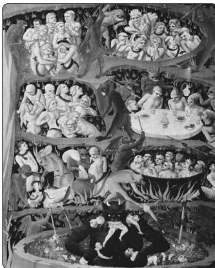
Fra Angelico (1395-1455): Peklo

Po přečtení tohoto děsuplného svědectví je záhodno si uvědomit, že se zásadně týká pravdy naší víry: člověku je dána možnost dobrovolně se odsoudit k věčnému a nepopsatelnému neštěstí skrze stejně tak dobrovolné odmítnutí věčného štěstí, kterým je Bůh. Ve chvíli přechodu z tohoto světa na věčnost padne konečný a neodvratitelný verdikt. Každý se bude osobně rozhodovat na základě toho, kým je, kým se stal během svého života. Již nyní v sobě nosíme schopnost rozhodnout se pro Lásku, anebo proti Lásce. V okamžiku smrti staneme před Bohem nikoli s abstraktní možností volby, nýbrž s konkrétní schopností, či neschopností