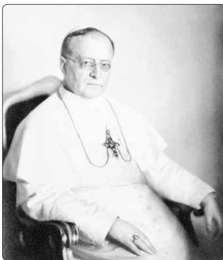
Papež Pius XI. (Do úřadu uveden 12. února 1922, zemřel 10. února 1939)

Co však je blaživější a lahodnější než myšlenka, že Kristus je našim králem nejen právem svého zrození, nýbrž také právem, kterého nabyl svým vykupitelským dílem? Kéž si všichni zapomnětliví lidé připomínají, co jsme stáli našeho