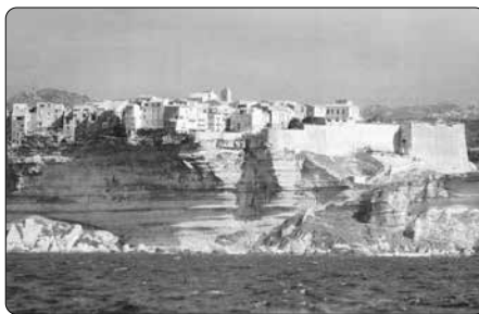
V přístavu Bonifacio napsal Newman báseň The Pillar of the Cloud

Období mezi léty 1864–1874 bylo pro Newmana co do publikování v oblasti teologie tím nejplodnějším. Jeho četné