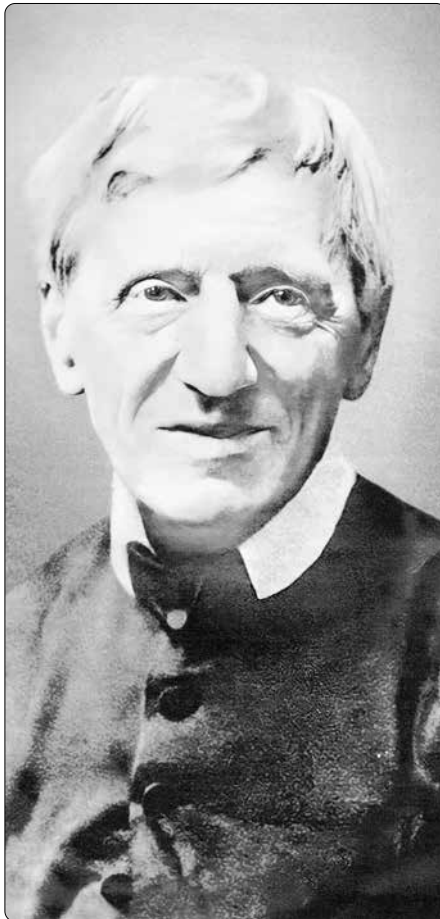
Kanonizační portrét J. H. Newmana

tělesní a nevěřící, jsou přesvědčeni, že pokušení, jež zakoušejí, a hříchy, jimž podléhají, patří k jejich přirozenosti – proto jimi nejsou vinni. Tímto způsobem zpochybňují existenci hříchu, který je největším neštěstím každého člověka. Nelze jít po cestě víry do plnosti štěstí v nebi, pokud se na mém začátku této cesty nezačne nenávidět hřích.“ Proto se Newman modlil těmito slovy: „ Stvořil jsi nás, Bože, abys nás učinil šťastnými. Naše štěstí závisí na poslušnosti Tobě. My jsme však hledali štěstí na svých vlastních cestách – opustili jsme Tě. Ó můj Bože, jak Ti splácíme, jak já Ti splácím, když hřešíme! Jak strašný nevděk! Jaký bude trest za to, že odvrhnuji své štěstí a volím si peklo místo nebe! Víím, řekneš: »Ať si dělá, co chce! Hledá ztracení a záhubu, tak