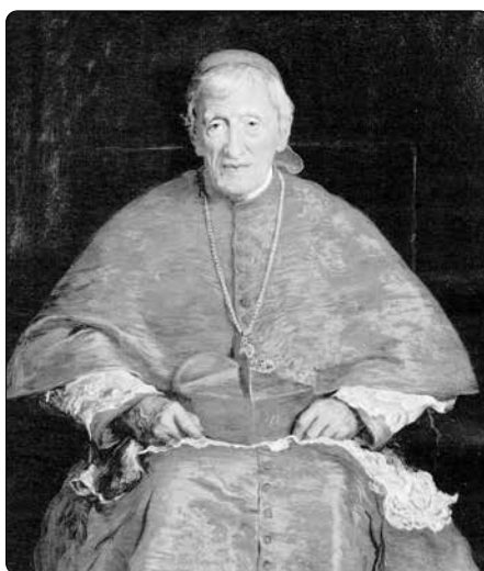
Lev XIII. v roce 1879 jako výraz uznání Newmanova přínosu v oblasti rozvoje teologického myšlení povolal Johna Henryho do kolegia kardinálů katolické církve

Kardinál varoval zkroušené hříšníky před netrpělivostí, aby si neordinovali přílišné množství modliteb a kajících skut-