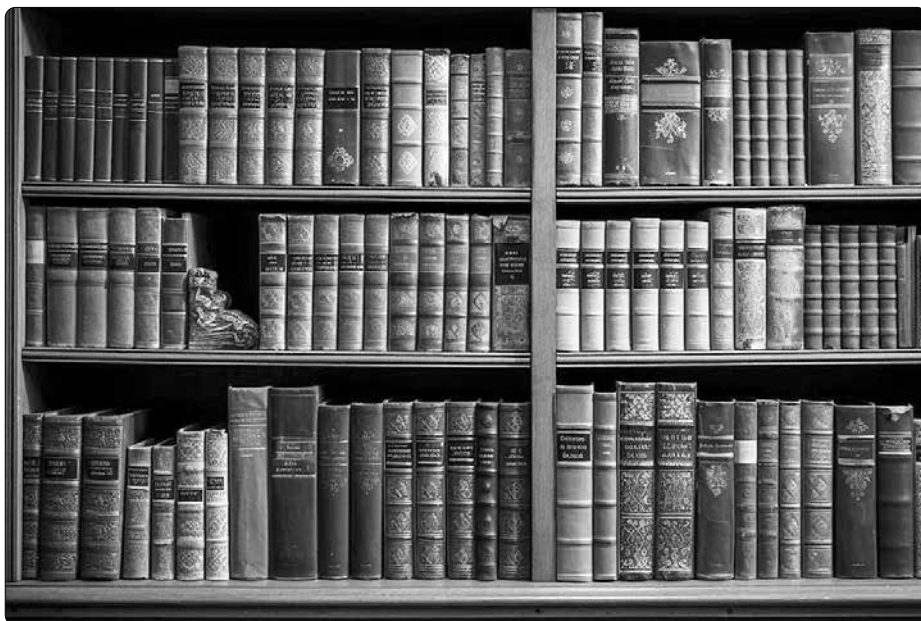
Studiem spisů církevních otců došel Newman k závěru, že poklad víry zůstal zachován nedotčený pouze v katolické církvi

Několik dní po návratu z Říma – v červenci roku 1833 – inicioval Newman společně s Johnem Keblem, Edwardem Puseyem a Richardem Froudem vznik hnutí obnovy anglikánské církve. Šlo o tzv. oxfordské hnutí a John Henry byl jeho neoficiálním lídrem. Jedním z hlavních cílů tohoto hnutí bylo zajistit anglikánské církvi nezávislost na státní moci a bojovat proti liberalismu, který podkopával základy křesťanské víry, jelikož zpochyb-