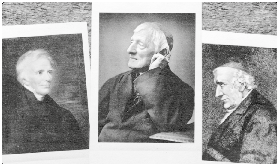
Iničiátoři oxfordského hnutí: John Keble, John H. Newman a Edward Bouverie Pusey

Pane, jsi svatý ve všech svých dílech. Hřích ve světě nepochází od Tebe – pochází od nepřítelů, pochází ode mne samého a z toho všeho, co je moje. Mne i všech lidí se týká tato hanba, poněvadž místo toho, abychom tíhli k dobru, poddali jsme se zlu. (...) Ty mě k sobě pozveš, až umřu, a budeš mým Soudcem. „Běda mi, jsem ztracen. Jsem člověk nečistých rtů a mezi lidem nečistých rtů bydlím.“ (Iz 6,5) Tvůj kříž, ó Pane, překlenuje propast dělící mě od Tebe. Hovoří o mé nehodnosti a o Tvém nepopsatelném odporu ke hříchu. Nauč mne, ó můj milovaný Pane a Spasiteli, abych chápal hluboký význam Tvého kříže a abych skrze Tvůj svatý kříž nejen pochopil, jak mě od Tebe hřích vzdaluje, ale abych dosáhl smíření s Tebou!