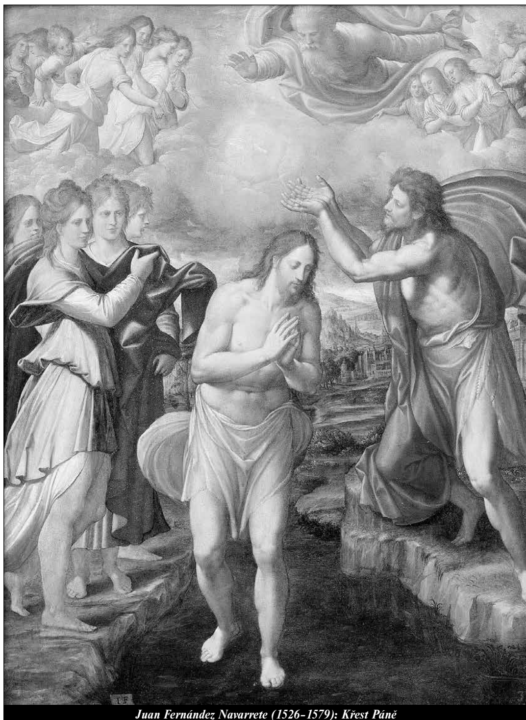
Juan Fernández Navarrete (1526-1579): Křest Páně