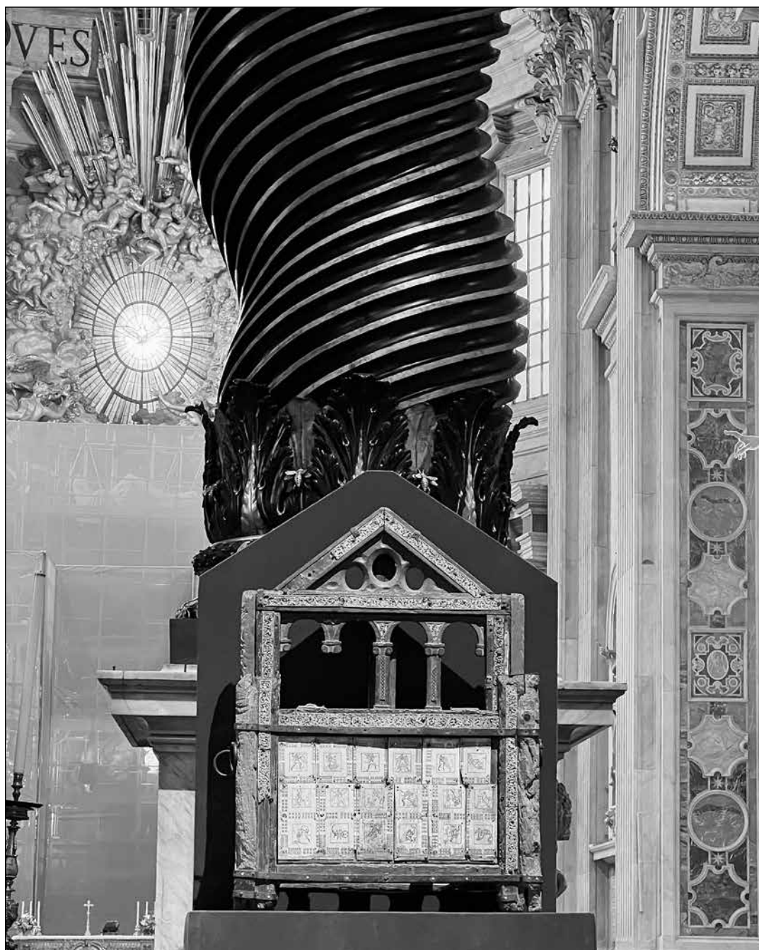
Židle svatého Petra (latinsky Cathedra Petri), známá také jako Trůn svatého Petra, je relikvie uchovávaná v bazilice svatého Petra ve Vatikánu. Relikvie byla v této bazilice vystavena v roce 2024. Stalo se tak poprvé od roku 1867.