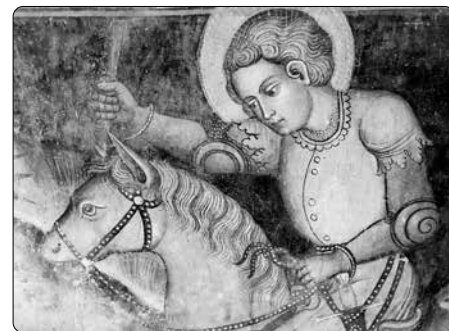
Detail fresky zobrazující svatého Crescentia, který zabíjí draka, sakristie oratoře San Crescentino, Morra, Città di Castello

Když začalo kruté pronásledování křesťanů, ukrývala Praxeda mnoho věřících ve svém domus ecclesiae - domě církve, dávala jim jídlo a duchovně je živila Božím slovem. O tom se dozvěděl císař Antoninus Pius a jeho vojáci překvapili křesťany při modlitebním setkání. Dvaadvacet věřících a též jejich kněz sv. Seme-trius byli bez soudního procesu na místě zabiti. Ještě téže noci Praxeda posnášela všechna mrtvá těla mučedníků, setřela jejich krev a zařídila, aby byli pohřbeni v Priscilliných katakombách. Jen dva měsíce nato, 21. července (rok smrti všech vzpomínaných svatých se neuvádí) následovala i ona tyto svědky víry na smrt a byla pohřbena vedle svého otce a sestry.