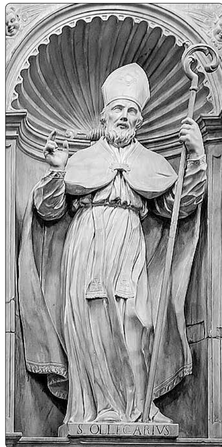
Svatý Olegarius, barcelonská katedrála

Do obnovy zejména zbídačené arcidiecéze tarragonské se Olegarius pustil se zápallem člověka, jemuž jde o dobrou věc. Vynikal svědomitou pastorační činností namířenou na obnovu svěřené církevní provincie. Podporoval kolonizaci zdejší krajiny, lákal sem i rytíře, kteří