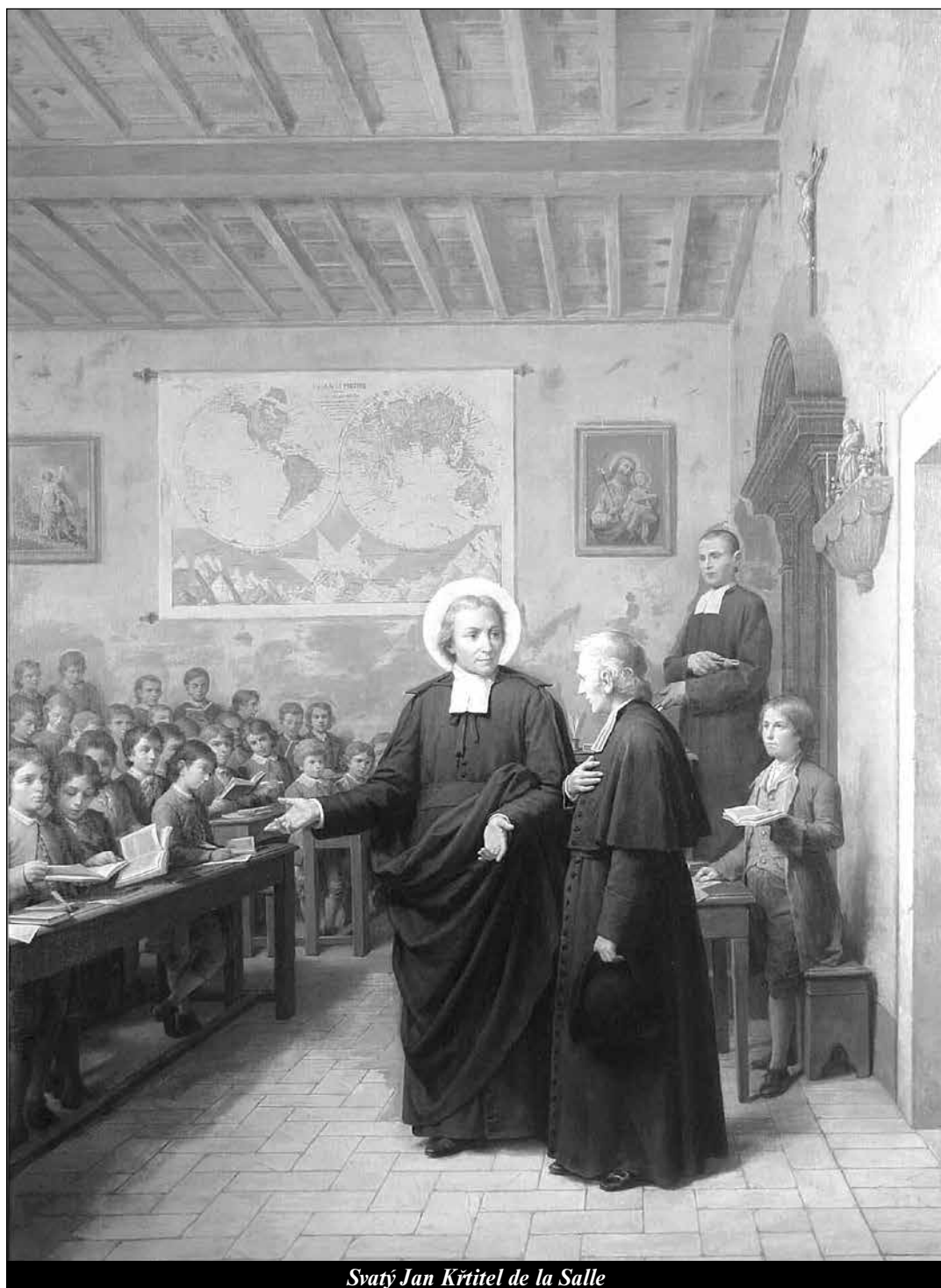
Svatý Jan Křitel de la Salle