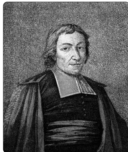
Svatý Jan Křtitel de la Salle

Začátky byly krušné. Už jen skutečnost, že úroveň dobrovolných učitelů nebyla nijak valná, Janovým snahám rozhodně nepřidala. Nejednou je musel sám dovzdělávat. Je přitom záhodno připomenout, že on sám měl díky svému původu vzdělání prvotřídní, znal jazyky, vyznal se v umění, hrál na hudební nástroje, bezpečně se pohyboval i v oblasti etikety. Postupnými krůčky nakonec dokázal nejen vydržet, ale i své dílo prosadit, přesně v intencích rady, kterou často udílel: „ Nemějte žádné obavy z budoucnosti. Vše svěřte do Božích rukou. On se o vás postará. “