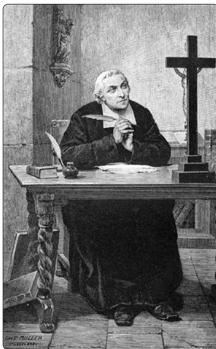
Svatý Jan Křtitel de la Salle

Jan Křtitel de la Salle vedl přísný asketický život, ale z jeho tváře byste to nepoznali. Rádost v ní malovala obraz šťastného člověka všemi možnými tahy svého štětce. Jan Křtitel dělal vše ke slávě Boží, oddaný Bohu a Panně Marii, na nichž stavěl vše, co podnikal. „ Obdivujte Boží dobrotu, její schopnost uspokojit všechny potřeby jeho tvorů, obdivujte i prostředky, které používá, aby lidem zajistil poznání pravého dobra a toho, co se týká spásy jejich duší, “ říkával. O žité víře svědčí i další jeho věta: „ Vnitřní pohled živé ctnosti víry přivádí mysl a srdce do stavu tiché lásky a úcty, vědomí vlastní nepatrnosti a touhy spojit se se