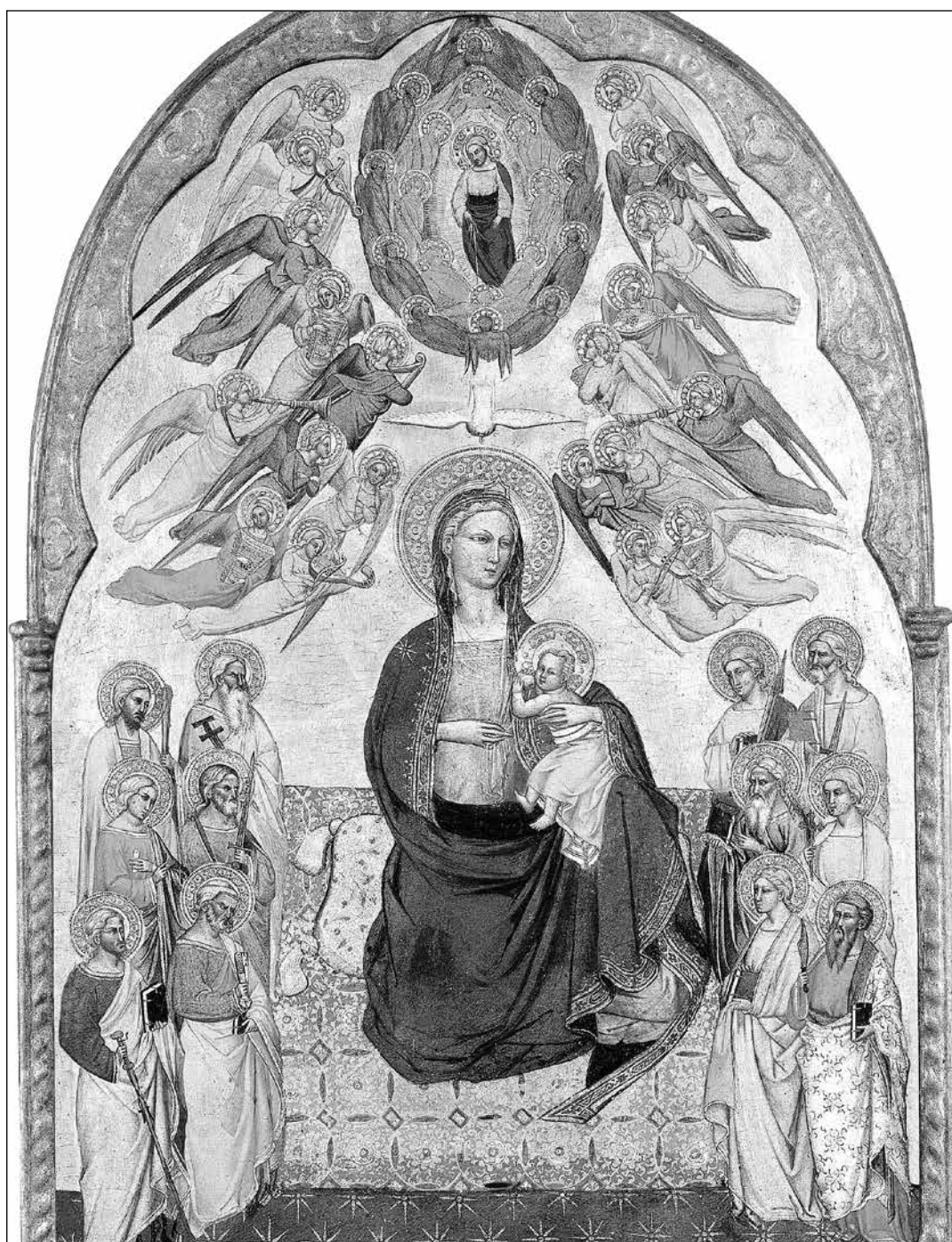
Cenni di Francesco (italský gotický malíř činný v letech 1369/1370 až 1415): Panna Pokory s Bohem Otcem, Synem a Duchem Svatým (tempera a zlato na desce, Wikipedia)