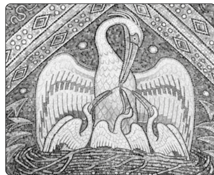
Pelikán v dómě v Cáchách

O ptáku pelikánovi se vypráví toto: Měl mlád'ata už pozdě na podzim. Nebyla schopná letu do teplých krajín. Nebyla ještě opeřená. Přišla zima a mráz. Pelikán se živí rybami. Jednoho dne se vydal hledat pokrm pro svá mlád'ata. Všude pod ním sníh a led. Vrací se zpět a slyší jejich hladové volání. Odletí znovu na jinou stranu. Zase nic nenašel. Protože mlád'atům je zima, začal vytrhávat ze svého těla pírka a kladl je na ně, aby jim bylo tepleji. Mlád'ata ucítí krev, která mokuje z poraněných míst. Vrhají se na ni. Když to pelikán vidí, rozklouvává si svou hrud', aby děti mohly pít. A tak s rozdrásanou hrudí umírá, aby prodloužil život mlád'atům.