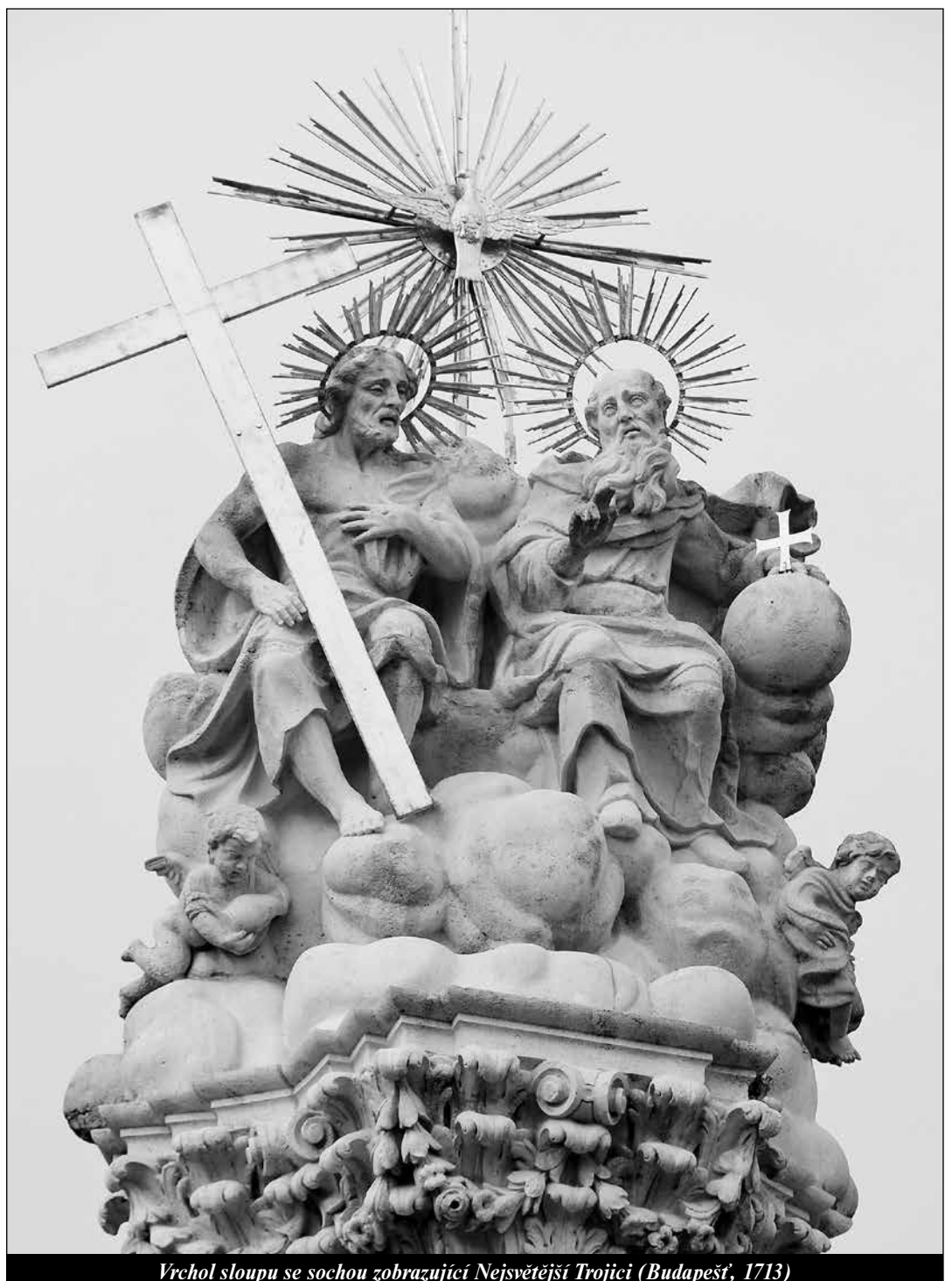
Vrchol sloupu se sochou zobrazující Nejsvětější Trojici (Budapešť, 1713)