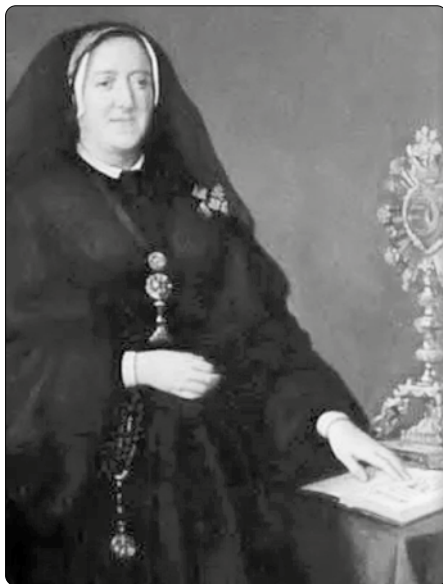
Svatá Marie Michaela od Nejsvětější svátosti