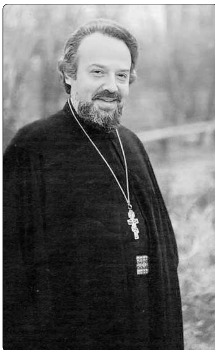
P. Alexandr Meň

Alexandr Meň byl především člověkem modlitby a obětavé kněžské služby, kterou chápal jako zpřítomňování spasitelského poslání Krista Ježíše. Byl šťastným člověkem, poněvadž žil v jednotě s Bohem a přinášel lidem Ježíše ve slově Božím, ve svátosti smíření a Eucharistii. Často