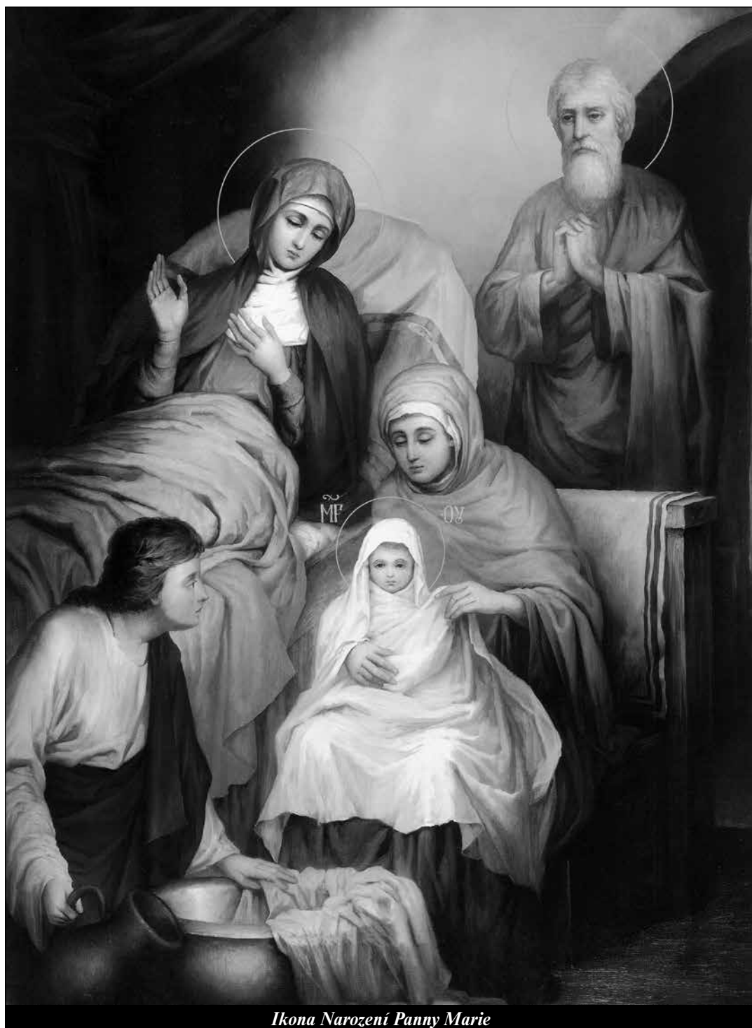
Ikona Narození Panny Marie