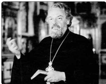
Lidé, kteří se o neobyčejném knězi dovídali, za ním jezdili z celého SSSR

Meňova činnost měla též značný vliv na arcibiskupa Zbigniewa Stankiewicze, stávajícího řížského metropolitu. Ten ve svých 14 letech ztratil víru. Během svého duchovního hledání vyzkoušel buddhismus, jógu i spiritualitu Dálného východu, které ho, jak sám přiznal, zavedly do slepé uličky. Díky četbě knih P. Meňe se nejenže vrátil ke křesťanství, ale přijal též svátost kněžství a biskupské svěcení v katolické církvi.