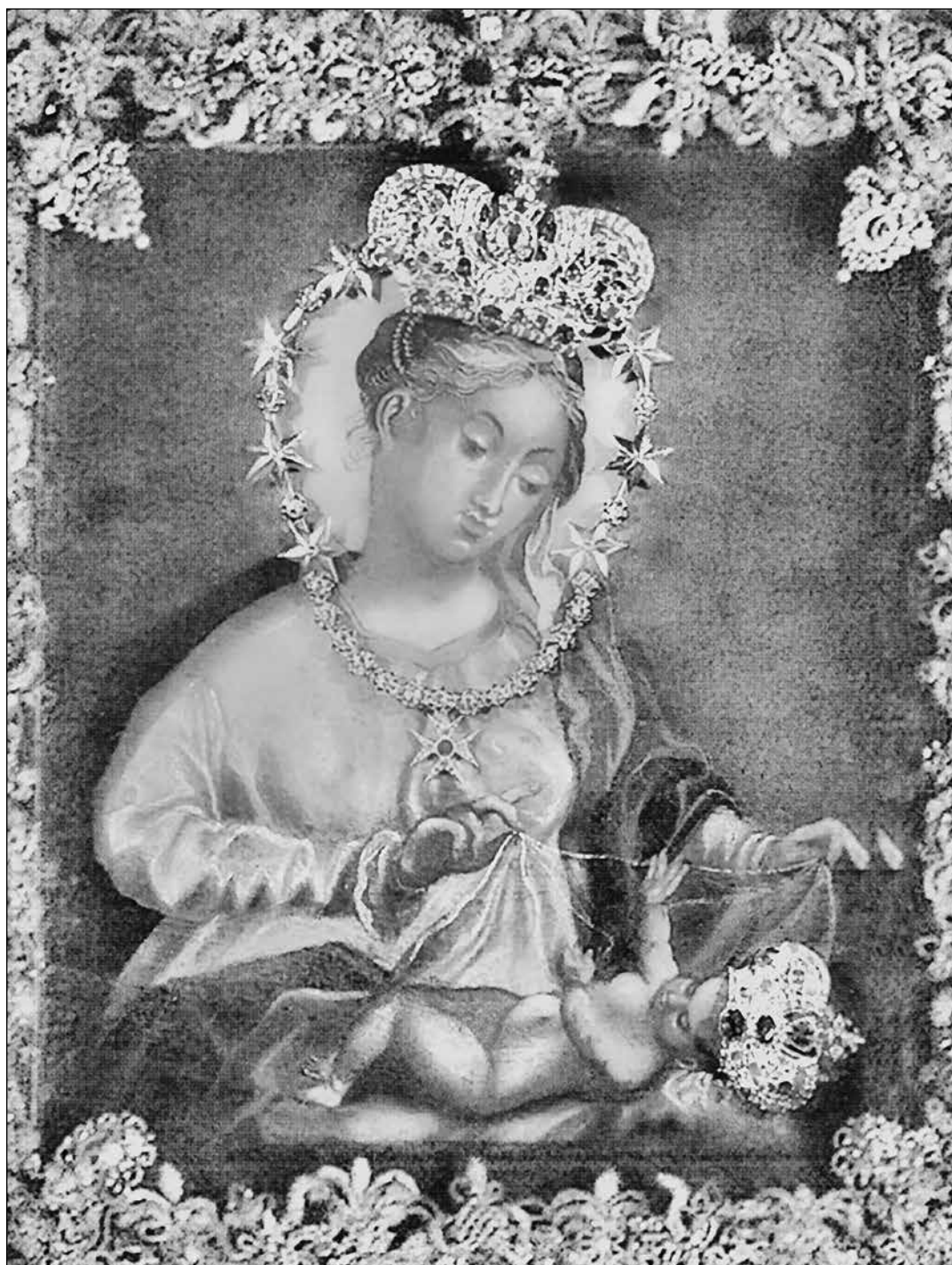
Milostný obraz Bohorodičky ze svatyně Maria Plain na hoře Plainberg (více na straně 22)